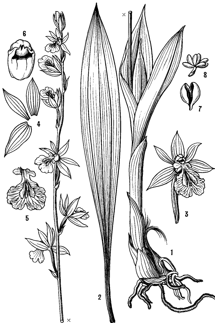
155 ひだぶちえびね Calanthe lamellata HAY. 台湾の山地には稀ではあるが、相当広範囲に分布する。私は本種は日本・中国大陸などに自生するサルメンエビネと同種だと考える。 C. tricarinata LIND., in WALL., Cat. no. 1339 (1821) et Gen. et Sp. Orch. p. 252 (1840) = C. lamellata HAY., Ic. Pl. Formos. IV. p. 70 (1914) syn. nov. Found in the evergreen broad leaved tree forest of Taiwan.