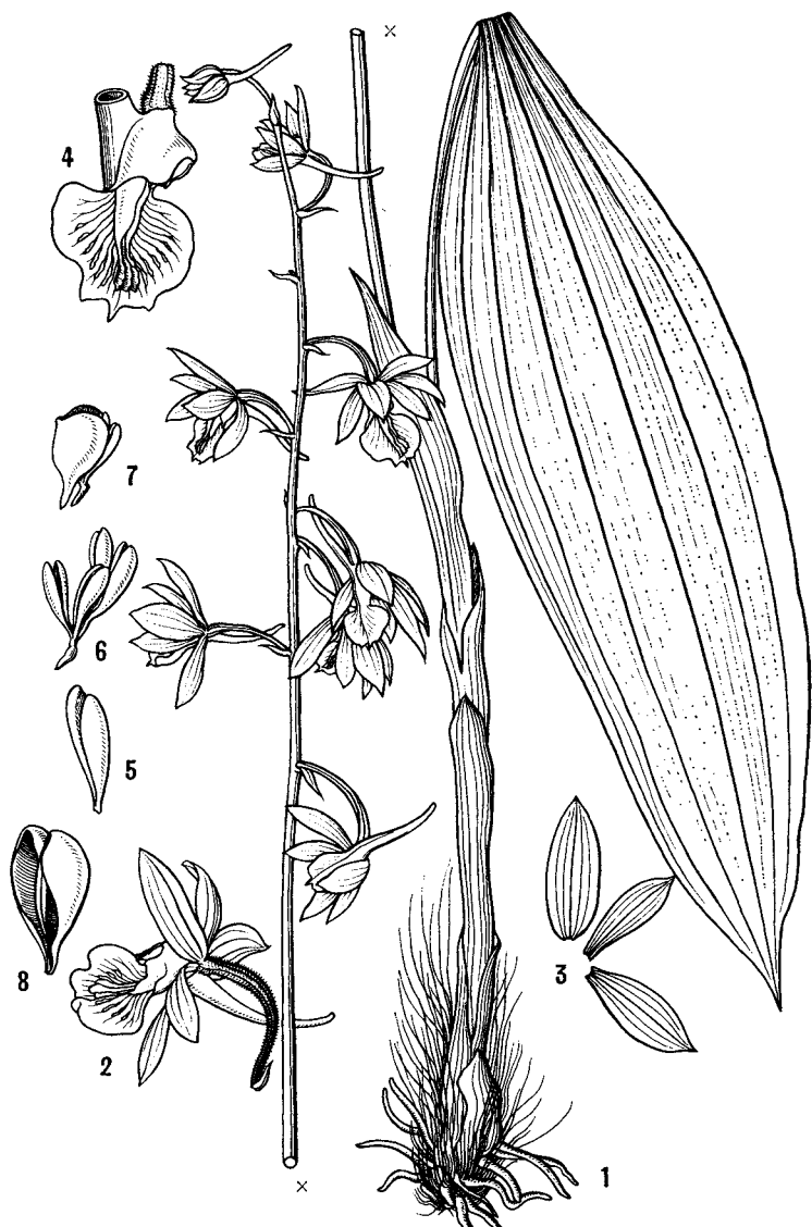
156 ひろはのえびね Calanthe elliptica HAY. 台湾の山地，常緑広葉樹林の林床に見出される。Found in the forest floor of the evergreen broad leaved tree forest of the mountain region of Taiwan.