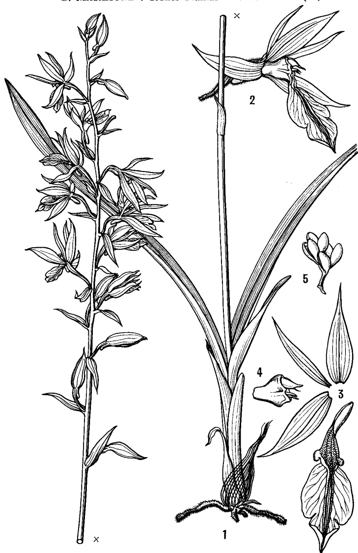
154 とがりばえびね Calanthe caudatilabellata HAY. 台湾の山地の常緑広葉樹林の林床に見出される。Found in the evergreen broad leaved tree forest of the mountain region of Taiwan.

G. MASAMUNE : Icones Plantarum Asiaticarum (38)