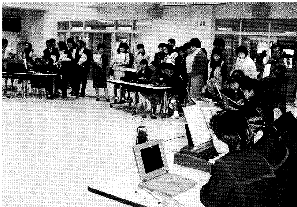
ランチルームでの音楽の授業

丸1日中回線をつないだままにしておき、普段の様子も含め、いろいろな情報交換が子どもたち同士で自然に交信できるようにしている。