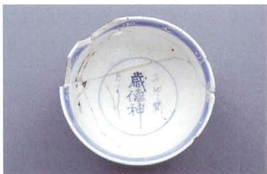
文政2年染付碗 見込