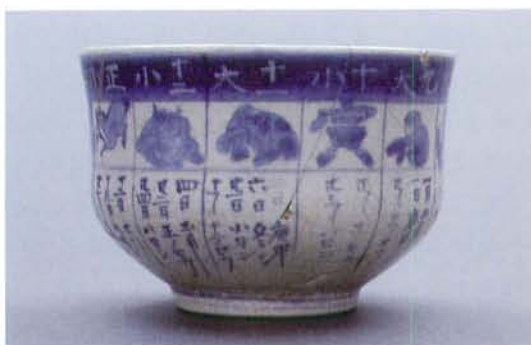
文政2年染付碗 口径10cm 高さ7cm

現在でも京都に陶器の暦手抹茶碗を作る作家がいる。数年に一度ほどの頻度で正月にむけて暦手茶碗の注文があるという。暦という性質上、正月から使い始めると考えるのが自然であろう。しかし茶会記には暦の茶碗が使われたとの記載がない。出土品は小振りであるため、大振りの煎茶碗と考える方が良いのかも知れない。ただし煎茶道でも暦手茶碗の用途は知られていないという。金沢大学内で出土した暦手碗の、いくつかの破片が焼継ぎをしていることを考えると、大事に使っていたことがうかがえる。縁起物として一年間大事に使ったのであろうか。大きさからは、正月のお福茶碗に良い。江戸時代の加賀での正月行事を想う。