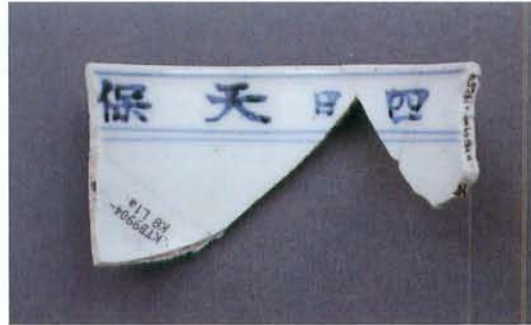
天保6年色絵碗 内面