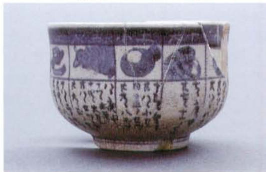
文政8年染付碗 口径9.4cm 高さ6.7cm