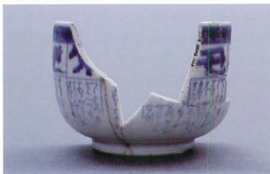
文政5年染付碗 口径9.6cm 高さ6.7cm