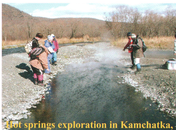
Hot springs exploration in Kamchatka,

幸運にも2002年、金沢大学COEプロジェクトのためにエネルギー分散X線分析装置付き電界放出型エネルギーフィルター透過電子顕微鏡(LEM-2010FEF)が導入されました。これにより電子線のエネルギー損失を用いて試料中の二次元的元素分布を調べ、最適なコントラストで像を観察することが可能となります。電子顕微鏡の技術は、微生物の挙動に関連した高分解能構造観察、微小領域化学分析、鉱物学的知見を多数与えます。これらの活動は生態系の真にダイナミックな側面の面白さを再認識させてくれました。