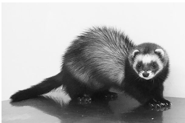
図1. 食肉類哺乳動物フェレットの外観。