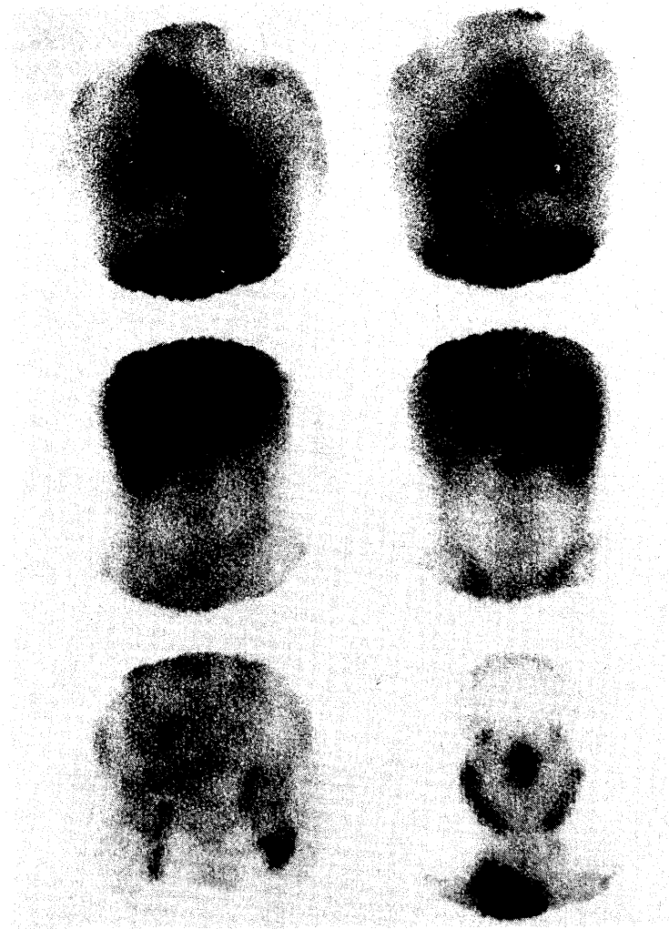
Fig. 1 Ga-67 scintigraphy showed abnormal radionuclide uptake in nasal cavity, bilateral parotid to submandibular areas, right supra-Clavicular area, left subclavicular area, right upper mediastinum, bilateral pulmonary hila, heart, porta hepatis, and bilateral inguinal areas.