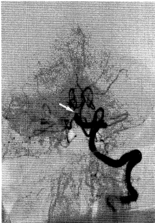
Fig. 3 Angiography shows occlusion of basilar artery (arrow).

出しえないことが多い。本例でも同様でありX線CTでは異常を検出しなかった。 ^{99m}\text{Tc} -HM-PAOは ^{123}\text{I} -IMPと異なりキット形であるためいつでも検査が可能であり、臨床的に非常に有用である。しかも、脳内分布は静注後数分以内に固定し、以後何時間も一定である 2) 。また ^{99m}\text{Tc} 標識のため投与量を多くすることができ、全体の検査時間も非常に短くて済むことも利点の一つである。また投与量を多くすることができるためSPECT装置はなるべく解像力に優れたものを使用することが必要であろう。今回用いた装置は島津社製リング型SPECT装置HEADTOME II 3) であるが、高分解能コーリメータを用いた場合FWHMはスライス中心において10mmと通常のカメラ回転型SPECT装置よりも優れている。临床上は解像力は良いにこしたことはなく、さらに優れた解像力を有するSPECT装置が望まれる。