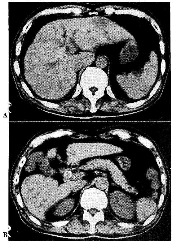
Fig. 1 X-ray CT shows air in the intrahepatic biliary tree (A) and a large stone in the common bile duct (B). Gallbladder is not identified well and hepatic flexure of the colon is noted between the hepatic right and left lobes (B).

検査成績：体格：180 cm，73 kg，体温：36.6°C，WBC：10,500/mm 3 (↑)，RBC：294×10 4 /mm 3 (↓)，Hb：9.6 g/dl (↓)，Ht：29.4% (↓)，血小板：14.9×10 4 /mm 3 ，総蛋白：7.8 g/dl，総ビリルビン：1.58 mg/dl (↑)，GOT：16 KU，GPT：13 KU， \gamma -GTP：78 IU (↑)，Al-P：12.2 KAU，血清アミラーゼ：115 SU (↑)，エラスターゼ：7950 ng/dl (↑)，CEA：4.1 ng/ml (↑)，CA 19-9：137.0 U/ml (↑)