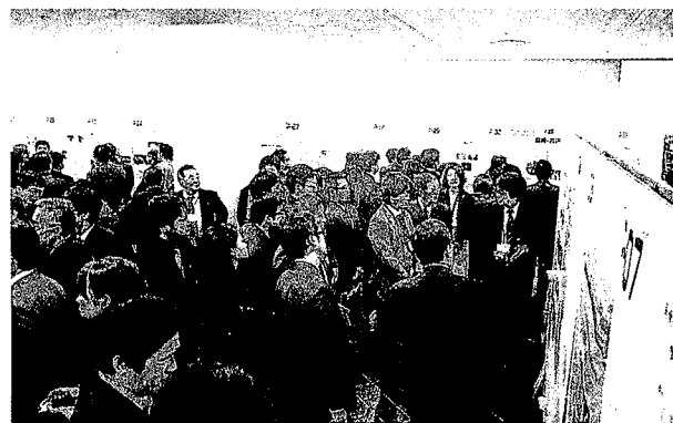
ポスター会場での討論