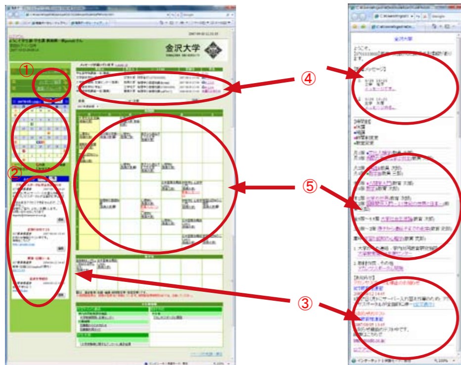
<ログイン後トップ画面 (PC) >