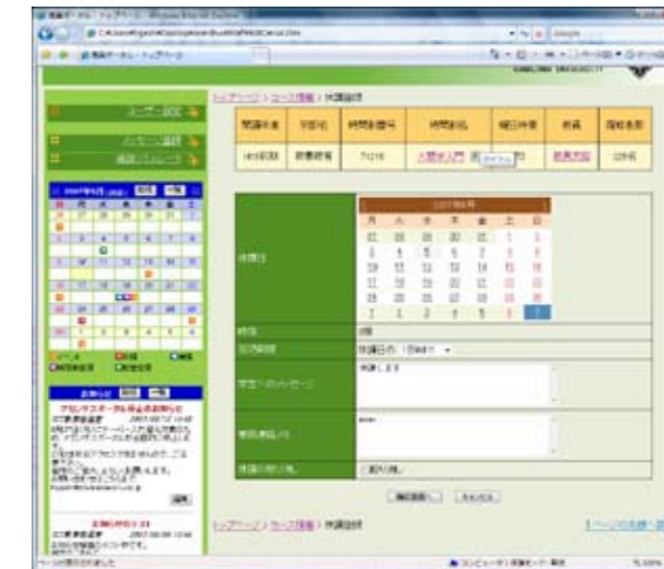
<休講情報入力画面>

担当授業をクリックすると一覧画面になり、一覧画面で「新規」をクリックすると休講、補講情報が登録出来る。