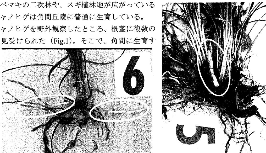
Fig. 1 角間に生育するジャノヒゲの野外にみられる根茎のタイプ

53個体から得られた計174芽由来の伸長する根茎それぞれの長さとおさを計測した結果、根茎の成長パターンは2つあることが判明した：「長さが一定で太くなる」根茎と、「太さが一定で長くなる」根茎、の2つである。また、根茎には「頂芽由来の根茎」と、「側芽由来の根茎」があり、「頂芽由来の根茎」は「長さが一定で太くなる」根茎のみであるのに対し、「側芽由来の根茎」は両方の成長パターンを示していた。また両者の中間型はなかった。ジャノヒゲの「側芽由来の根茎」は葉の伸長方向に対してほぼ垂直に伸長する「垂直型」と、ほぼ平行に伸長する「平行型」がある。「側芽由来の根茎」の成長パターンに垂直・平行という角度の形質を加えてみると、「長さが一定で太くなる」根茎は「平行型」を、「太さが一定で長くなる」根茎は「垂直型」を示していた (Fig.2)。これらの結果から「側芽由来の根茎」には成長パターンが質的に異なる2つのタイプがあることがわかった。