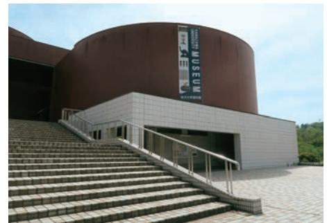
ようこそ、資料館へ

今回、指定を受けたことを契機として、教職員の皆様の協力をいただきながら、博物館としての活動を一層充実させ、教育、研究、そして社会に貢献する事業を行ってまいります。