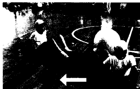
写真2 ボールを床に水平に動かす渡し方