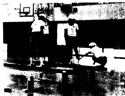
写真8 平均台での教え合い