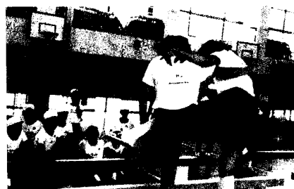
写真5 全体での動きの紹介

特に、バランスボールや平均台などの用具を使った運動では、一人の動きだけでなく、人数を増やした動き方を考え、できる動きが増えていった(写真6, 7)。バランスボールでは、一人でもバランスをとることが始めは難しかったようだが、バランスがとれるようになると、バランスのとり方を工夫し始めた。また、人数を増やした動きを考え始めた。「チャレンジ10運動」では、個々に運動に取り組んでいたため、そのコーナーに集まるメンバーはいつも同じメンバーとは限らない。そこで、人数を増やした動きに挑戦したいと思ったら、自分から相手を見つけて、挑戦するしかなかった。そこには、かかわる必然性があり、相手がどのような動きをしたのかを理解し、一緒に動き方を試さなければならなかった。自分の挑戦したい動きを相手に伝え、その動きを試し、バランスが取れるようになると、自然とかかわりが密になっていた。また、友達の動きを見て、「やってみたい」という思いが出てくると、その動きを友達に教えてもらう姿も見られた(写真8)。教える側も相手に分かりやすく動きのポイントを伝えていた。そして、教えた相手ができるようになると、教えた側も教えられた側も喜びを感じるとともに、教え合うことのよさも感じていたようであった。