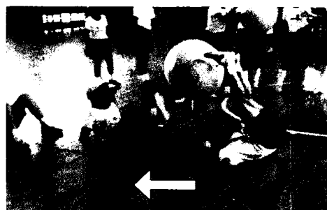
写真1 ボールが頭の上を通る渡し方