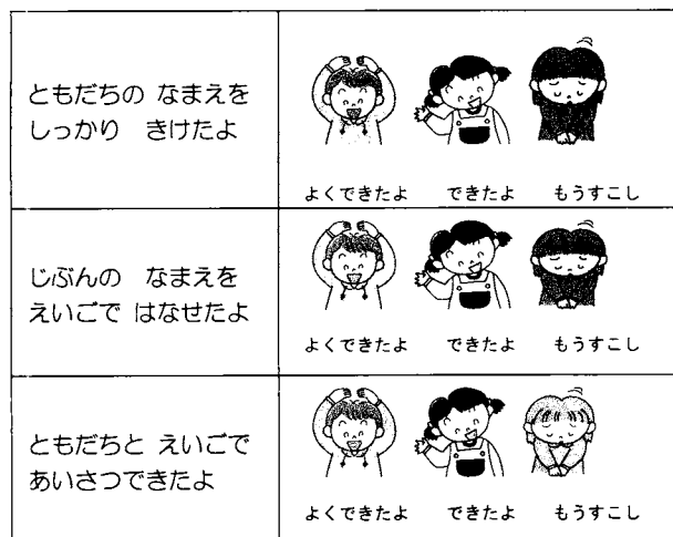
資料1 自己紹介の学習でのふりかえり用紙

三つ目は、ふりかえりの場の設定である。子どもは3つの観点（「聞く」・「発話する」・「かわる」）で学びをふり返った（資料1）。最初は自分があてはまると思う絵に丸をつけただけだったが、徐々に楽しかったことや難しかったことを文章でふり返るようにしてきた。その結果、色の授業のふりかえりでは「いろいろな色があるので、まちがえずにゲームをするのが難しかったです。けれどもおもしろかったから、何回も（色を）言ってみたかったです。」などの記述も見られた。これによって子ども自身が英語の時間に何を学び、何に難しさを感じたか自覚していると考えられる。しかしこのような子どもはまだ少ないため今後もふりかえりの場の継続が必要である。基本表現に繰り返し触れ、相手意識を持って発話し、自分の活動をふりかえるという授業展開を毎時間経験することも知識創造の素地を養うことにつながるだろう。