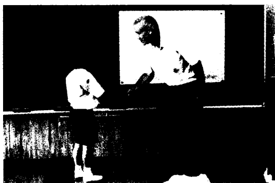
写真1 ALTと1対1で自己紹介

最初に本時に至るまでに採ってきた手だてについて考察し、子どもがどのような状態で本時を向えたか述べる。これによって知識創造の力を育むための考察とする。なお学んだ内容は1回目「ALT との出会い」、2回目「英語での挨拶・自己紹介」、前時となる3回目は「色」であった。子どもは学びを重ねるごとに英語への興味・関心を膨らませてきた。この間、知識創造の力を育む重要な入門期であるため、子どもが英語をしっかりと聞いて発話できるように子どもの実態をふまえながら以下の3点に留意して授業を行った。