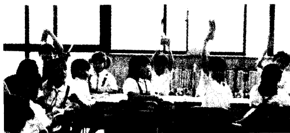
写真 5 歌に合わせて短冊を挙げる