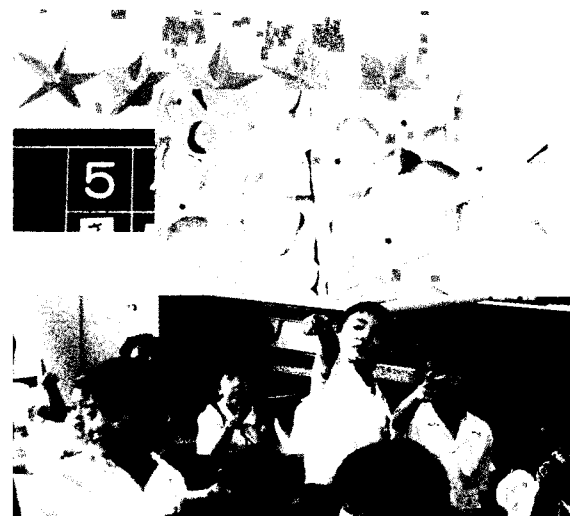
写真3 教室掲示された色の星(上)と指定色の星をさす子ども(下)

次に『Sing A Rainbow』に合わせて教室に掲示した7色の星を指さす活動を行った(写真3)。この活動で子どもは聞いた色を意欲的に探して指さしていた。一斉に色を指さすため、色の表現を確実に分かっていない子どもも友達と関わりながら色を探せた。誤って覚えていた子どもも周りに合わせて指さしているうちに分かる色を増やしていった。