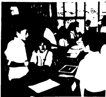
資料6 グループでの聞き合い

3時は、各自が自分で好きな鳥を選んでクイズを作った。ここでは、4種類の鳥から選択した。だ いしゃくしぎの学習を生かし、どの子もクイズ作りができた。その後、グループで聞き合い、アドバ イスをもらっていた(資料6)。友だちに聞いてもらうことで、もう一度、自分のクイズを見直してい た。もう一度、写真を見て特徴を書き直したり、「思ったことを入れたい。」を書き加えた子もいた。 (資料7)。友だちに聞いてもらうことでいっそう相手意識を持つことの大切さを感じたようである。