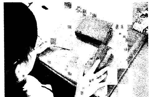
まずは土台の分を切り分けるところから