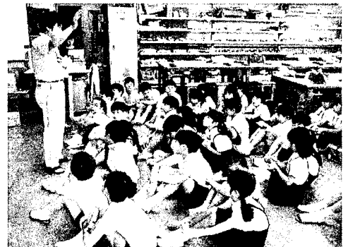
土粘土 持ってみてどんな感じかな

子どもは、製作に入る前の段階で「どんなタワーにしようかな」「土粘土って油粘土とだいぶ違うのかな。早く触ってみたいな」と意欲を膨らませていた。話し合いが終わるといつも以上に素早く準備にとりかかり製作に入ってしまった。この様子からも子どもそれぞれに表してみたいイメージがある程度発想できていたのではないかと推察できる。