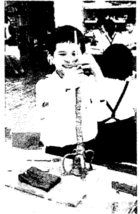
わりばしをいれたから大丈夫だよ

そこで、材料の扱い方やつくり方の共有化を図るために、製作の途中で鑑賞の場を設けた。グループごとに席を離れて両隣の作品だけでなくクラス全員の作品を見て回るように指示した。製作中の友だちに声をかけ、感想を述べたり、つくり方を尋ねたり逆にアドバイスしたりという交流が見られた。この日の終わりに書いた学習カードに“～さんのこんなところが「おーっ!」「すごーい!」「すてき」だったよ!”の項目から、タワーの脚を恐竜の脚に似せてつくった子、星形の飾りをつけた