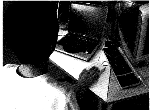
簡易スイッチによる学習場面

簡易スイッチは見てすぐにわかり積極的に操作しようとした。学習ソフトウェアは教師が示す操作のモデルで興味をもつことができ、すぐに学習に取り組むことができた。ボタンを連続して入力する【風船バン】【ドレミでおえかき】は操作による画面の動きをすぐに理解できたようで、楽しんで活動できていた。タイミングを考えながらボタン入力する必要がある【回転ずし】では、操作と画面の動きの関連性を理解するのに時間がかかり、教師と一緒に操作する活動を繰り返した。同じ学習内容を第4時で、タイミングを考えながらボタン操作を行うことができた。