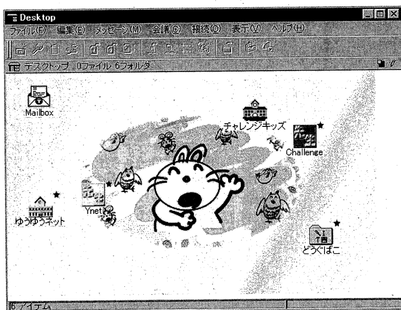
図1 チャレンジキッズのデスクトップ画面

ここで使われているファーストクラス* 2 という電子会議室システムは、必要に応じた利用者のグループ分けと、そのグループに応じた利用制限が比較的容易に設定できるシステムである。またGUI* 3 での利用環境は直感的に操作しやすく、必要に応じて会議室を開くなどの際に音をつけたり、背景に親しみやすい絵を表示したりということも容易に行える。このシステムをうまく利用し、児童生徒が進んで参加したくなるような工夫を凝らしたり、利用者に応じ