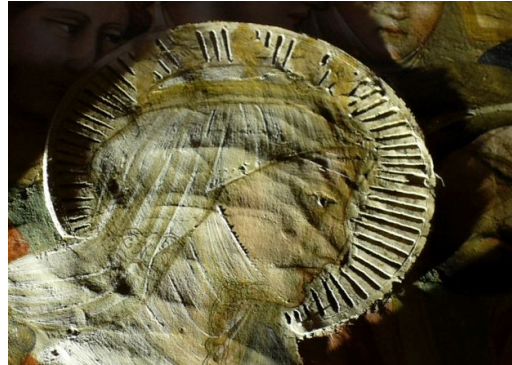
写真2 木目細かな盛り上げ材によるインチジョーネ式の円光(斜光線照射)

王侯貴族の服飾、兵士の甲冑や馬具の鋳などに施された蜜蝋を主材料として盛り上げられた「蜜蝋の技法」(写真3) 錦糸模様や王冠に使用された金箔や、錫箔に金箔を貼り合わせた金貼り錫箔、そして武具甲冑の白色金属の表現に使われた銀箔や錫箔、これら箔材を使用した「金属箔の技法」(写真4) 以上の3技法に分け、以下の方法で技法解明に取り組んだ。