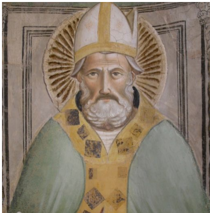
写真 5 イントナコと同じ盛り上げ材による円光：法衣には銀際の技法が使用された幾何形体の模様パターンが確認できる

前者に関しては、1つはチェンニーニの技法書に記された円光で、漆喰と砂を配合したフレスコ画の描画面の漆喰モルタル(イントナコ)と同じもので盛り上げられていた。しかしもう一方の円光は、漆喰の盛り上げ材の木目が細く、壁画内の重要な聖人に導入されていた。この木目細かな円光の復元実験では、盛り上げ材の砂と石灰の配合を変えたり、テンペラに用いられる羊皮紙膠を配合した二水石膏で盛り上げてみたりと、想定可能な材料で実験を繰り返した。その結果、砂に代えて大理石粉が配合されたものが最もオリジナルに近いことが判った。