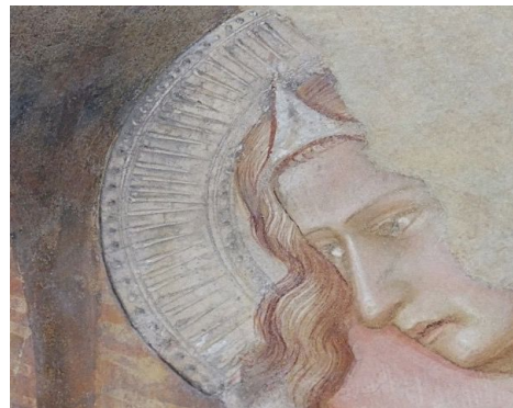
写真 6 木目細かな盛り上げ材によるスタンパ式の円光

以上のとおり、インチジョーネ式の方にメリットが多いことがわかる。事実、『聖十字架物語』には106の円光が存在するが、その中でインチジョーネ式のものが全体の約8割を占める。