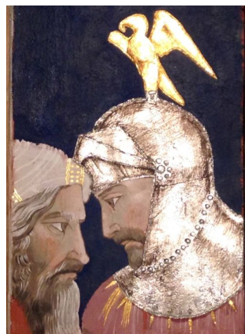
写真10 写真9の復元に暗闇の中で光を照らしたもの：金属箔の効果が一目瞭然で、完成時の金属箔の効果を垣間見ることができる