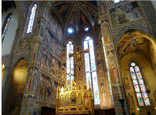
写真1 サンタ・クロッチェ教会主礼拝堂壁画『聖十字架物語』

そこで当壁画の技法研究を開始するにあたり、本科研では特に工芸的装飾表現に焦点を絞り、技法の解明に挑んだのである。