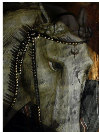
写真3 馬の手綱に施されたベージュ色の蜜蝋盛り上げ(斜光線照射)

なお、国外の研究協力者として、技法復元ではフィレンツェ修復研究所のマリアローザ主任修復士に、そして材料の復元では西洋