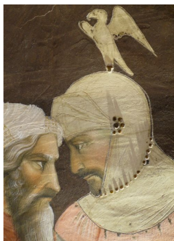
写真9 家中の兵士（オリジナル）

一方で幾何形体の連続で装飾する場合、例えばフリーズ等に見る幾何学的模様パターンが整然と並んだ箇所等には、ミッショーネより金貼り錫箔の技法が断然有効である。