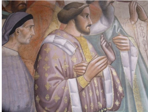
写真 4 繊細な筆致を持つ錦糸模様をあらわしたミッショーネの技法

古典絵画および修復の材料に精通したフィレンツェの老舗画材屋 ZECCHI に協力を得た。