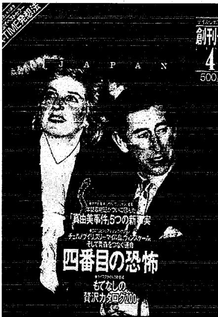
図1 『DAYS JAPAN』創刊号

の一部もその影響をうけ、後のオタク世代の起源になったとする 2) 。また、千石保は、同時代の意識調査の分析から、77年頃にそれまで日本人を支えてきた勤勉の価値観が崩れ、「なんのために学ぶか」「なんのため働くか」が問われたし、その時その場の楽しさを価値とするコンサマトリーな価値観が浸透するなど、明らかに変化が起ったとしている 3) 。