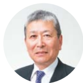
金沢大学 教育担当理事・副学長 柴田正良

1953年、大分県生まれ。中部大学国際関係学部助教授、金沢大学文学部教授を経て、現在に至る。2008年からは、金沢大学人文学類長、附属図書館長を兼任。著書に、「ロボットの心 7つの哲学物語」(講談社現代新書)などがある。