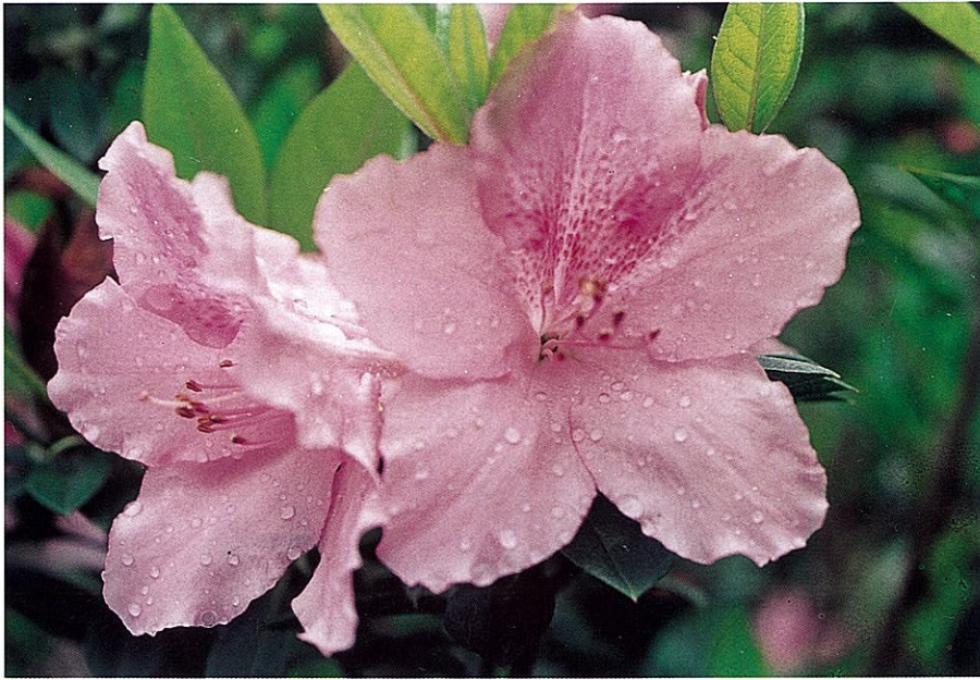
Fig. 2. Rhododendron scabrum f. roseum Hatus. & Kudaka