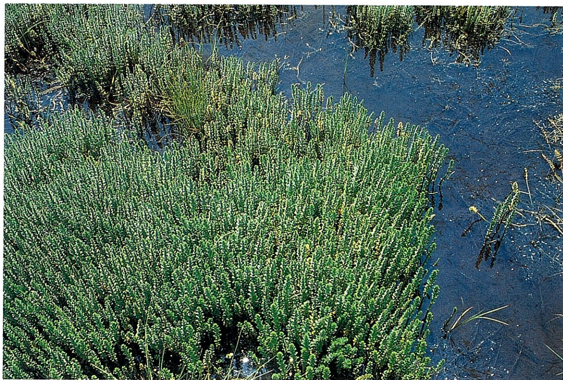
Fig. 1. Hippuris tetraphylla community

* 〒010 秋田市中通6丁目6-36 秋田県立秋田東高等学校 Akita Higashi High School, Nakadōri 6-6-36, Akita 010.