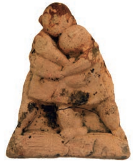
出土した土人形(力士)