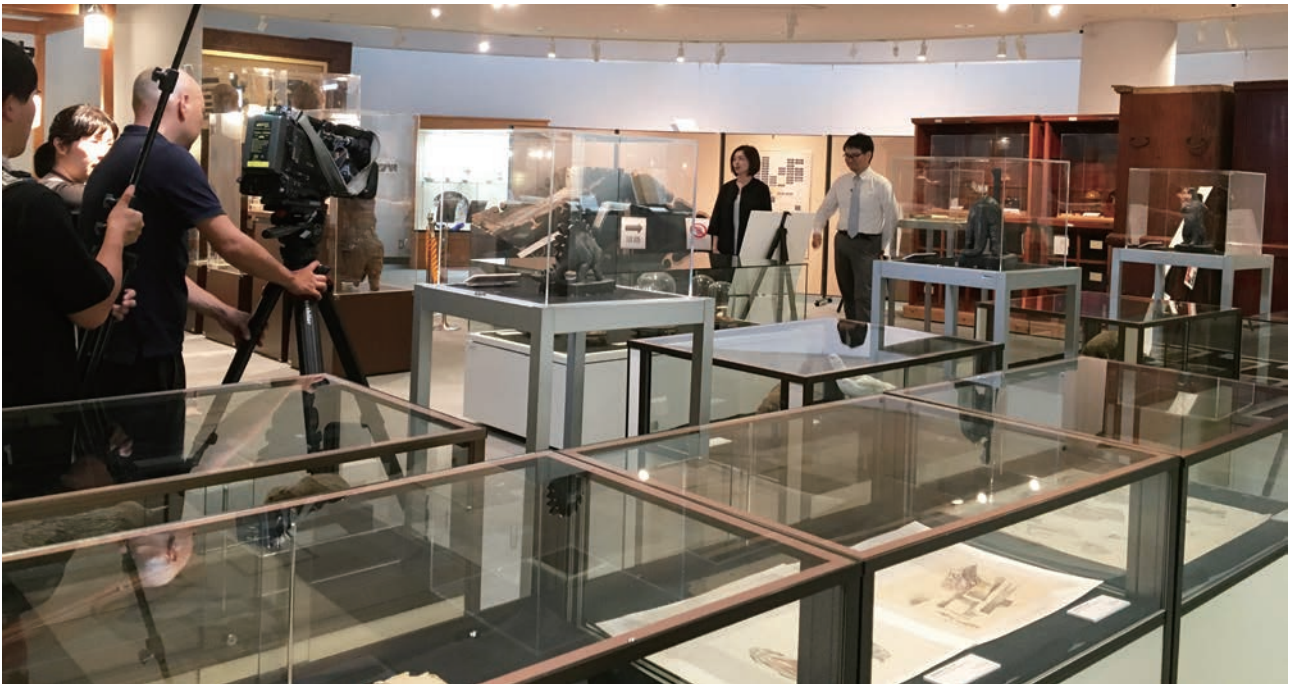
展覧会会場でのテレビ取材風景

本年度、当館は開設30周年を迎えることができました。これを記念し、「金沢大学資料館30年の歩み“1989-2019”」と題した特別展を令和元年9月4日(水)から10月28日(月)まで開催しました。