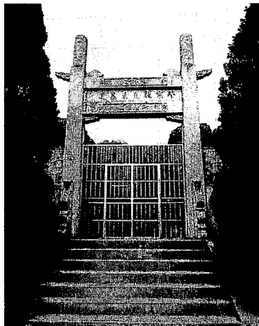
写真3. 榮宗敬の墓地の入口