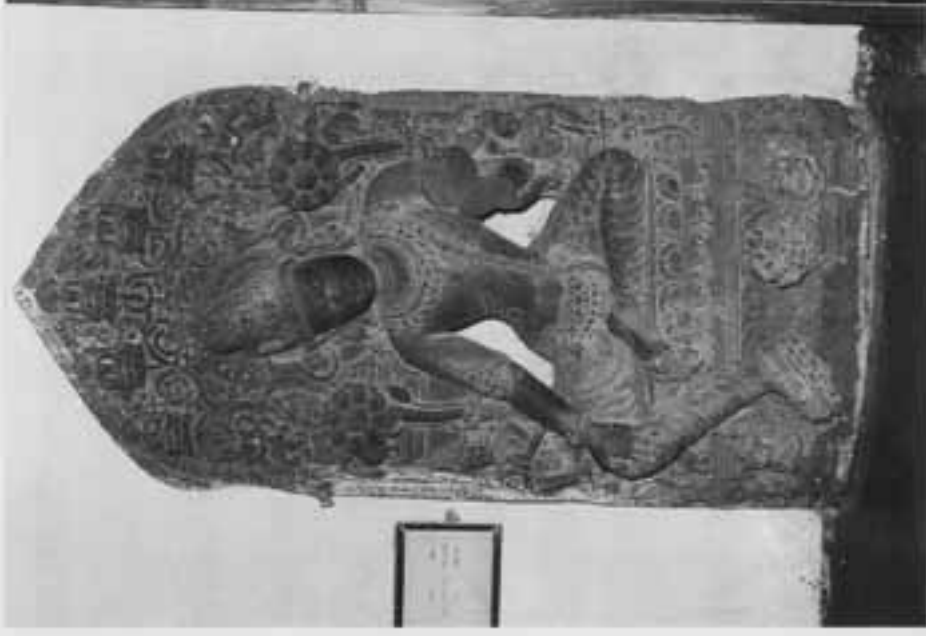
図10. カサルパナ観自在坐像