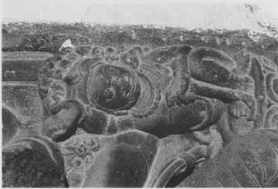
図11. 図10部分 (ハヤグリーヴァ)