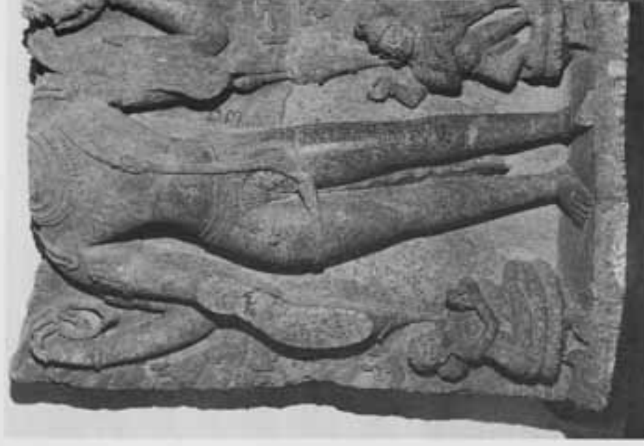
図12. 不空罽素親自在立像 (左脇侍はハヤグリーヴァ)