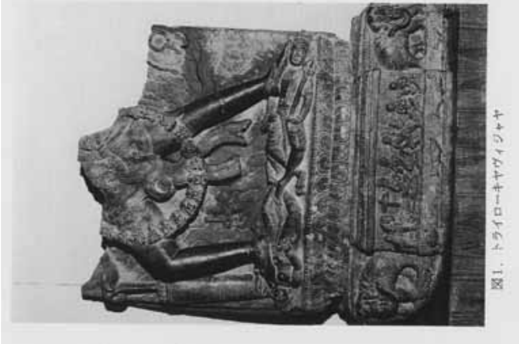
図1. トライローキヤヴィジャヤ