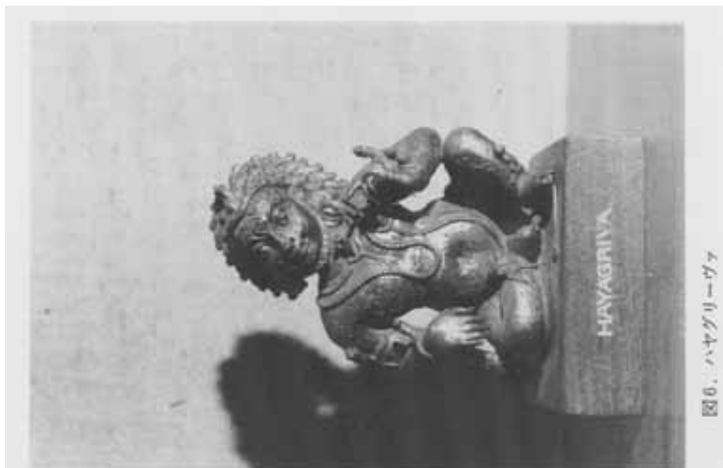
図6. ハヤグリーヴァ