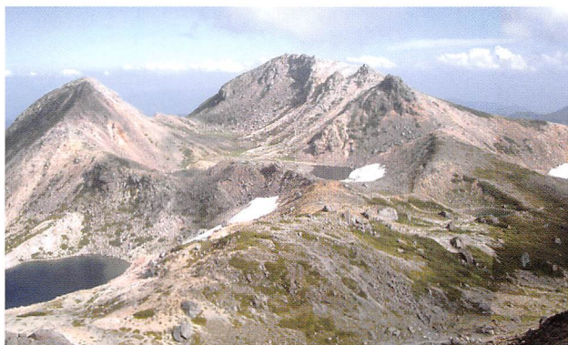
山頂部を大汝峰から見た白山