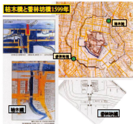
枯木橋と香林坊橋