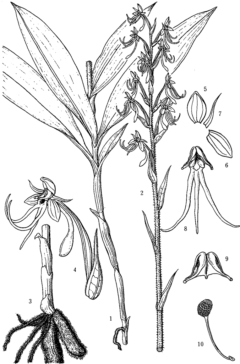
254 りうきうさぎそう Habenaria cirrhifera OHWI

琉球列島より台湾に自生。 This figure is drawn from the plant which I collected at the South Cape of Formosa.