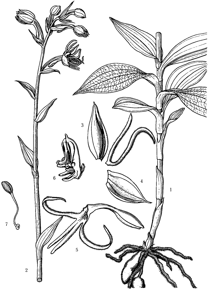
255 はごろもさぎそう Habenaria hosokawae FUKUYAMA

この図は台湾南部のチボン山で採集されたものを図にした。 The figure is drawn from the specimen collected at Chippon of Formosa.