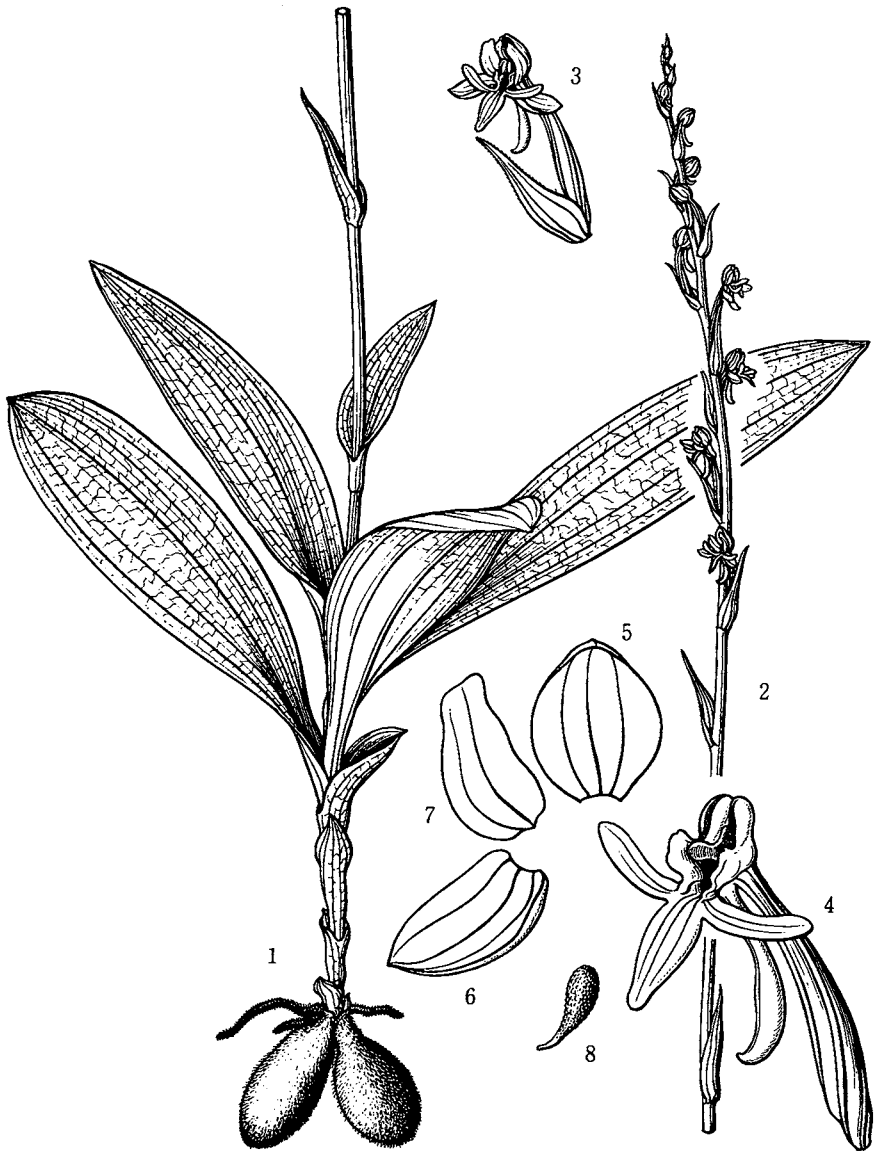
251 のりあきさぎそう Habenaria noriakii MASAMUNE sp. nov.