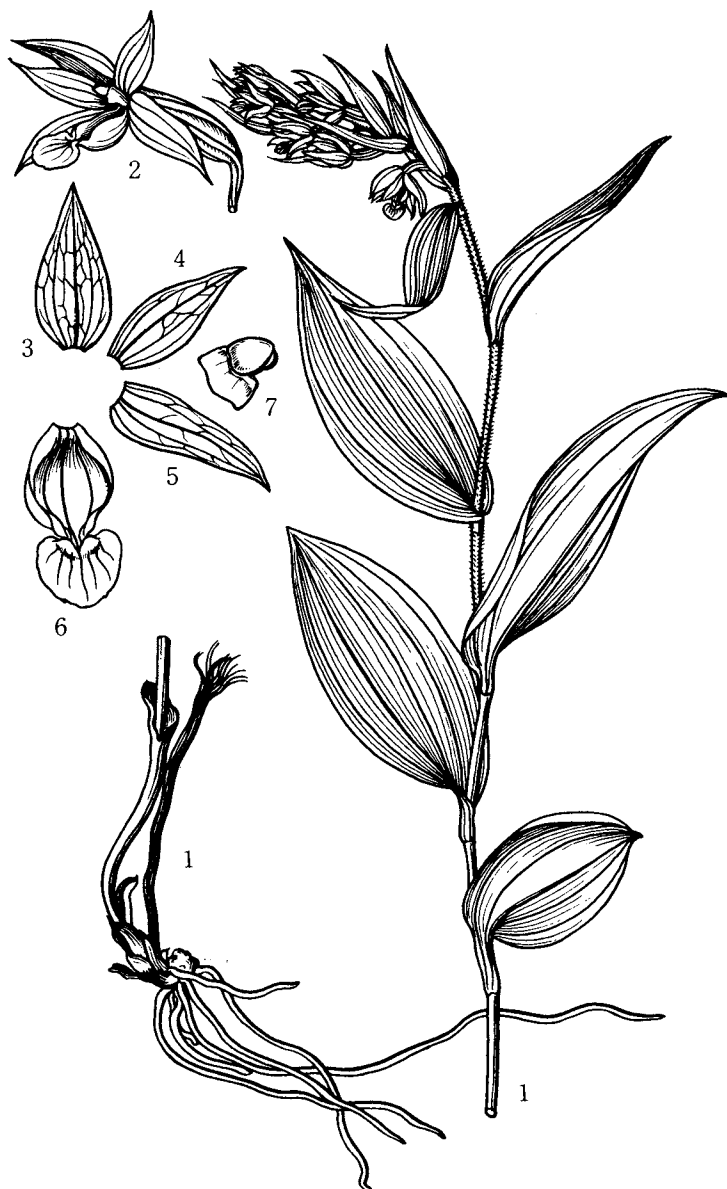
198 たいざんあおすずらん Epipactis ohwii FKUYAMA. 台湾の高山、草原に生ずる。 In Taiwan the orchid is found in the alpine meadow.