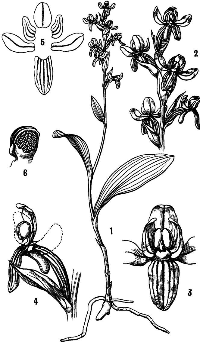
137 にいたかちどり Platanthera brevicealcarata HAY., Mat. Fl. Formos. p. 350 = Habenaria brevicealcarata (HAY.) comb. nov.

台湾の高地と九州の霧島山系，屋久島に分布する。Found in the alpine region of Taiwan, Isl. Yakushima and mt. Kirisima in Kyusyu. (MASAMUNE)