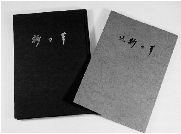
図 11. 「折々草」と「続折々草」

(古池 博：〒921-8062 金沢市新保本二丁目 14 番地 3 Hiroshi Furuike : Shinbohon 2-14-3, Kanazawa 921-8062, Japan)