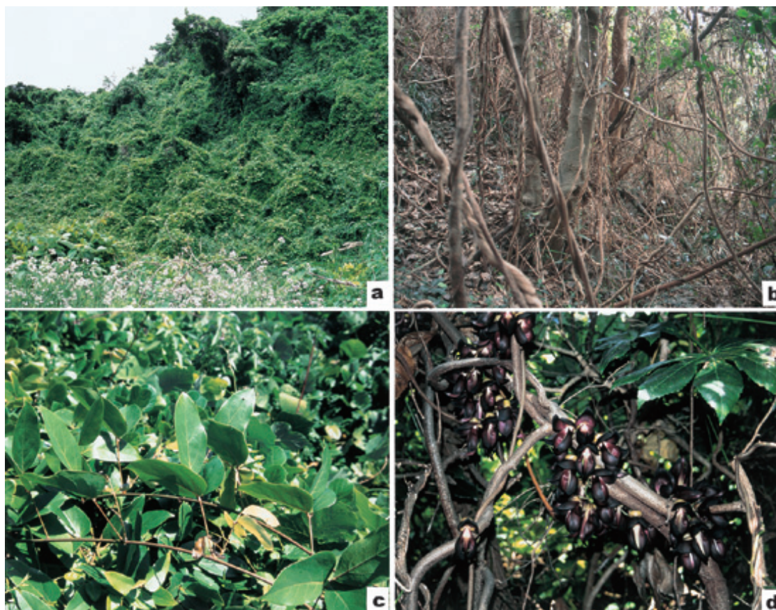
Fig. 1. Mucuna sempervirens . a: outer view of community. b: inner view of community. c: leaves. d: inflorescences.

部ほど色が薄くなり、皮針形で、やや内側に曲り、へら状となる。基部には白色と黄褐色の毛がある。竜骨弁は紅紫色、なきなた状で、先端は湾曲して尖り、基部は白色、先端部ほど色が濃くなる。2枚の竜骨弁は先端部でくっつき、雌蕊と雄蕊を被っている (Fig. 2 a, b, c)。雌蕊は上部を除いて褐色の毛が密生し、柱頭は頭状で、直下に毛がある (Fig. 2 e)。雄蕊は5本ずつ2型あり、一つは長さ2.6~3.4 mmの長い葯をもち、花糸は太さ0.5 mmで、葯の下には黒褐色の毛が散生している (Fig. 2 d 1)。他方は長さ1.5~2.0 mmの短い葯をもち、太さ約0.9 mmで、葯の下には黒褐色の縮れた毛が密生している (Fig. 2 d 2)。