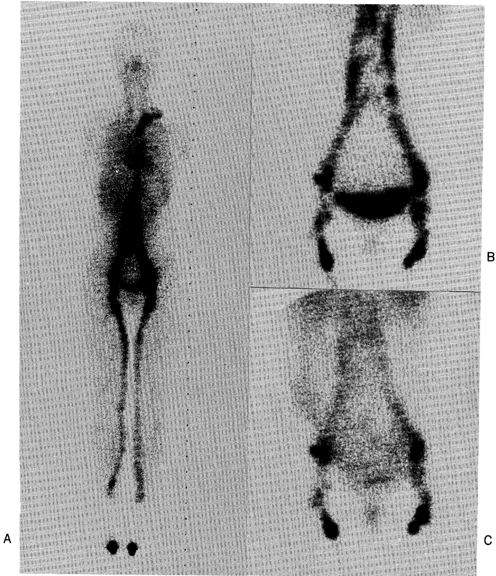
Fig. 1 A 30-year-old female with slight swelling of right lower limb. A) 15 minutes' whole body scintigram. B) C) Images of inguinal and iliac chains 30 minutes and 3 hours after administration.

colloid, ^{99m}\text{Tc} -rhenium-colloid の方が良好であったが、リンパ系の通過性を目的とした検査においては、 ^{99m}\text{Tc} 標識に対する簡便性、検査時間の短縮化など、リンパ節シンチグラフィにおける ^{99m}\text{Tc} -HSA は、有用であると思われる。