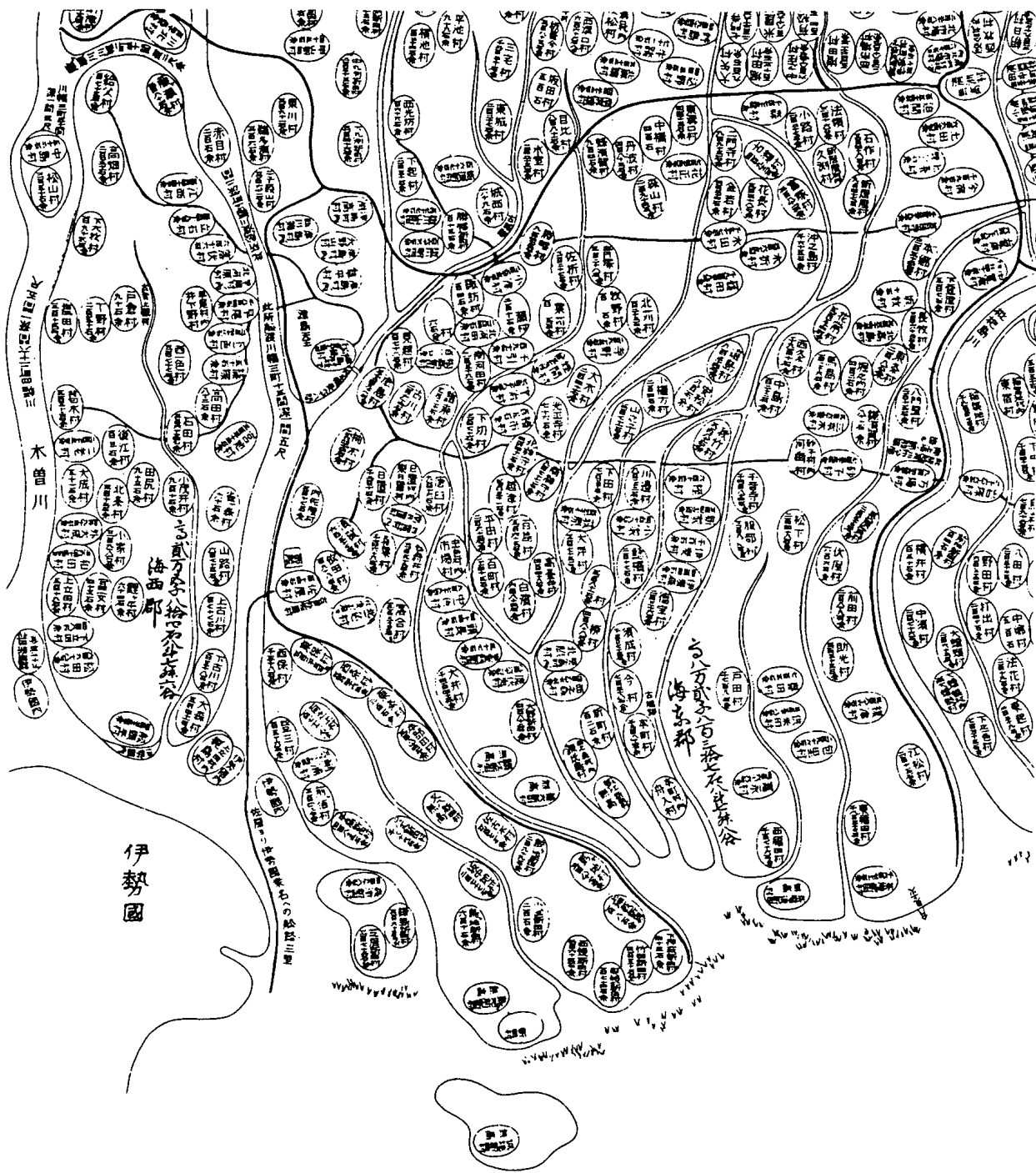
第1図 元禄14年の地図 (注(7)の付録図、原図は元禄国絵図)