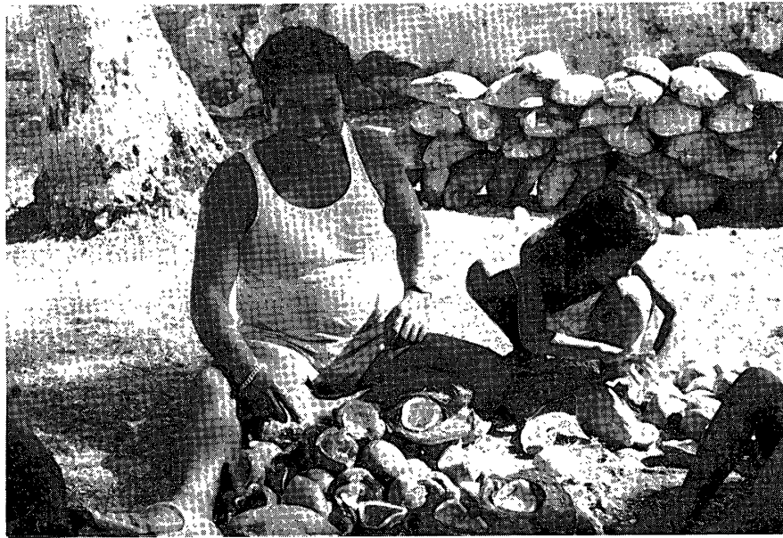
コプラ生産に希望を見出したレアオ島民

の10年以来政府の補助があり、コプラからの収入は以前とは比較にならぬ程増し、島民の生活水準は上がった。レアオにおける共有地は急速に減りだした。同時に非単系血縁集団 non-unilineal descent group の原則にもとづく親族間の連帯間識が崩れだした。これは土地所有制度の崩壊に起因していた。コプラの出荷からかなりの現金収入が入りだすと兄弟姉妹間でさえ共有地が分割されるようになった。経済的連帯がきれるや居住のパターンにも変化がおきた。1980年では45世帯のうち複合家族 compound family は12世帯にすぎなくなった。伝統的な里子の習慣も社会変化により影響を免れなかった。養子制度とはちがった里親制度はポリネシアに広く見られる習慣で様々な動機や理由があった。それは子無しの人の熱望、親族間の絆の強化、親族間や友人間での友情の確認や連帯の強化、経済的な理由からの親族間の相互扶助、経済活動における労働力の確保などであった。もし子供たちが成人する前に両親を失くした時には世帯は解体し、彼らは里親 makui fagai の所に行くのが常であった。1976年の調査時では47人の子供が里親の所で起居していた。18家族が子供を1人、あるいはそれ以上里子に出していた。私生児は一般に祖父母によって養育されたり、子無しの夫婦に引きとられた。近年の行政で里子に対して1人1か月2,000フラン (Pacific franc) の養育費を里親が申請できることになった。扶助を受けられる里子は里親の兄弟姉妹の子は該当しないが、伝統的な里子制度は性格を変えていくといえる。最近では白人との混血児が里子に好まれる。混血の私生児には里親の希望者が多く、子供の生活は問題なかった。小さな島社会で経済の変化が伝統的なポリネシア人社会の存続に最後のとどめをさしたといえる。