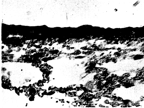
第 1 図 気管支壁