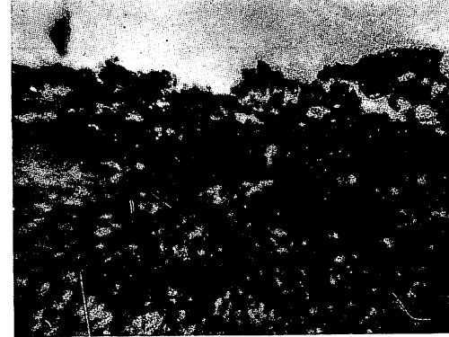
第 3 図 気管支壁リンパ組織