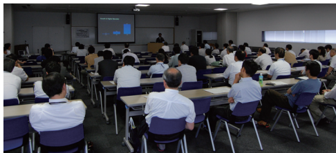
特別講演の様子 会場は、参加者で満員でした。

シンポジウム「ICT活用教育の未来と金沢大学の情報戦略」を7月8日に開催しました。今年度で5年目となったノートPCの必携化や、情報戦略本部のもとに行われている様々な情報施策についての今後を考えるシンポジウムでした。一連の活動についての報告に加えて、アップルジャパン株式会社エデュケーション本部による「教育におけるPC活用の現状」という特別講演もありました。