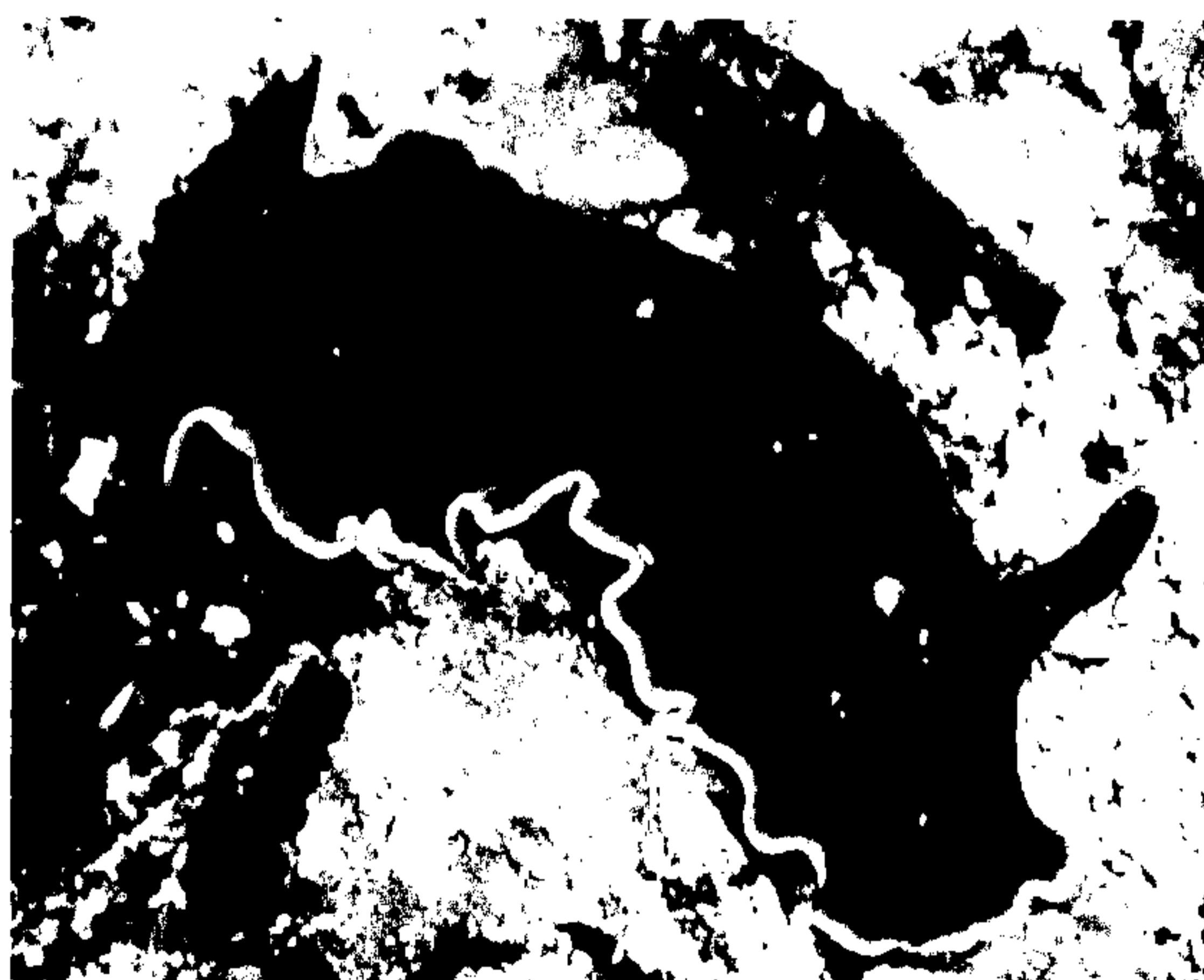
Fig. 1 Photograph of Dendrodoris fumata

Fig.1にクロシタナシウミウシの概観を示す。クロシタナシウミウシをMS222(Aldrich)で麻酔し、腸内容物を採取した。この腸内容物約1 mLを改変ALLEN海水 3) (NaCl 15 g/L, MgSO 4 · 7H 2 O 3.58 g/L, MgCl 2 · 6H 2 O 2.72 g/L, CaCl 2 · 2H 2 O 0.6 g/L, KCl 0.39 g/L, NaHCO 3 0.1 g/L) 9 mLに攪拌溶解した。この溶液を0.5 g/Lフェノールを含む改変ALLEN海水寒天培地（寒天濃度 20 g/L）に200 μLずつ塗抹し、15℃で4-5日間放置した。薬品は全て和光純薬工業製のものを用いた。数十枚の寒天培地の中で、一枚の寒天培地から数個のコロニーが確認された。この菌株をEBR01と命名した。