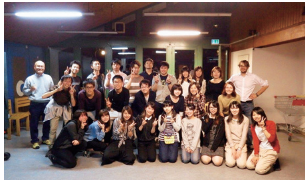
2015年度サマーコースに参加した先輩たち