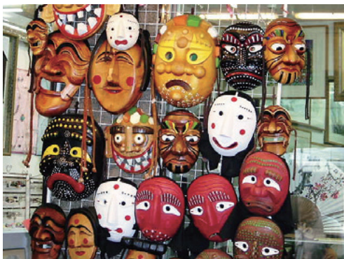
民俗色豊かなお面

私にとって、この短期留学はこれまで机の上で学んできた韓国語を、生活の中で使うという非常に意義のある経験でした。私が勉強してきたことの力試しでもあります。やはり実際に使うことが一番楽しくて、韓国語を学ぶことのおもしろさを再確認できた期間でした。私の韓国語のレベルはまだまだですがこの3週間での伸びは大きかったと思います。そして自分の弱い部分を知ることができたのでこれからの勉強にまた役立てていきたいと考えています。