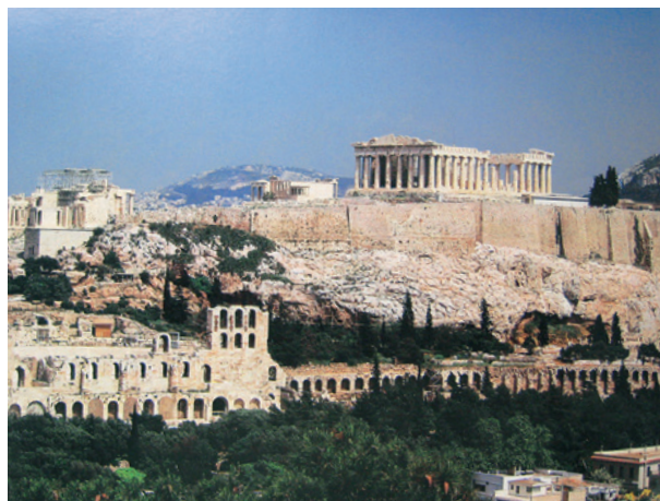
アテーナイ アクロポリス遠景

ギリシア語A1とA2で初級文法を一通り学び、A3とA4では文法の復習をしながら比較的やさしいギリシア語の散文を読みます。ギリシア語B、Cに進むと、プラトンの対話編やホメロスの叙事詩『イリアス』などを原書で読むことが出来るようになります。