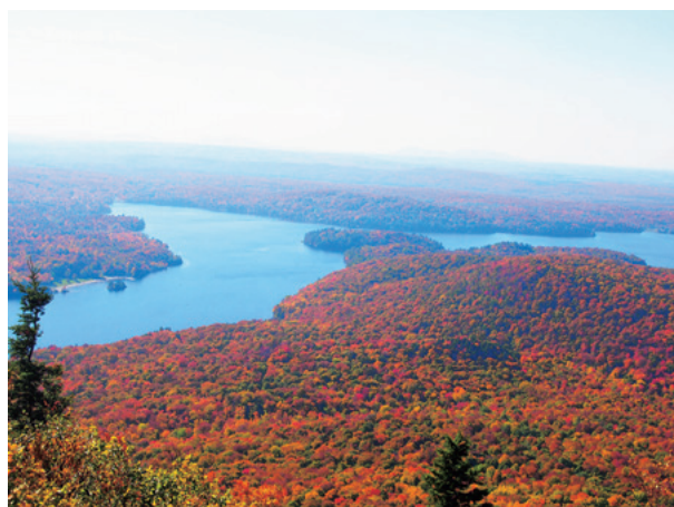
カナダ・ケベック州の紅葉

これから第二外国語を学ぶ皆さんに伝えたいことは、「言語はコミュニケーションの道具でしかない」ということです。どれほど検定試験で高得点をとろうとも、言語学習の目的は達成されません。「使って初めて」、言語を習う意味が出てきます。留学中は、使うことによって「もっと自分の意思をきちんと伝えられるようになりたい」「あの子ともっと友達になりたい」と意欲がわき、それが学習のモチベーションにつながりました。もし自分がフランス語を学んでいなかったら、留学先で出会った友達とは、友達になるどころか意思疎通さえもできなかったんだなと思うと、本当にフランス語を学んでよかったと思います。言語はコミュニケーションの道具の一つでしかありません。それを通して、人との出会いを広げ、自分自身を成長させることが言語学習の本当の醍醐味だと思います。留学したモントリオール大学には、カナダのケベック州だけでなく、フランス、アフリカ諸国、中東諸国、中国などから来た学生も多く、多民族・多文化が入り混じった都市でした。初習言語そして留学を通して、出会うはずもなかった友達と出会い、新しい世界に踏み込んでみませんか。