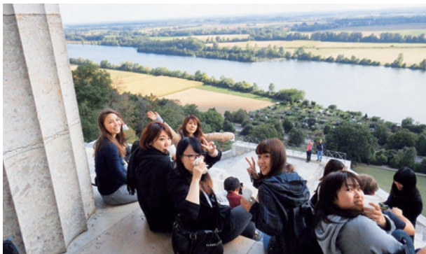
ドナウ河のほとりでワインを一杯

私は電気工学を勉強していて、ドイツは理工系も強く、ドイツの歴史や文化にも少し興味があったので一度大学にいる間、サマーコースを機にドイツに足を運んでみました。基本的に自分の意志で一ヶ月生活するので、自由時間を有効的に活用しました。私は工科大学など、ナチスの資料館や東西ドイツの歴史に関する博物館…etc十分に行きたいところも回れたし、そのうえ生活する中で“異文化体験”は現地でしか感じられないものがありました。サマーコース期間中、ドイツの街に8ヶ所も行けました。外国語でどうすれば伝わるのか工夫してコミュニケーションを取る(ドイツ語and英語)生活ができたのも良い経験でした。何よりも将来ドイツで研究したいとも思っていて、ドイツの生活が自分には合うことがわかっただけでも収穫でした。自分は海外に行ったり、冒険する事自体に全く抵抗を持っていません。むしろその場で如何に順応していくかが楽しみでもあり、成長する良い機会だと考えています。ドイツに興味か