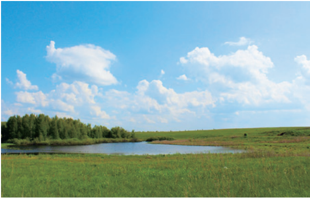
ロシアの大自然。地平線がつづきます（カザン）

ロシア語を学ぶ第一歩は、まずこのキリル文字の読み書きです。最初は少しいへんですが、多くの字がローマ字と対応していますから、慣れたら簡単です。A, O, K, M, Tはそれぞれ、ローマ字のA, O, K, M, Tに対応しています。ギリシア文字φからできたキリル文字Фはローマ字のFにあたり、пから生まれたПはローマ字のPにあたります。それから、Nがひっくり返ったようなИ(イー)、Rがひっくり返ったようなЯ(ヤー)など、ローマ字を書きまちがえたような文字も。一方、ローマ字のNに対応するキリル文字はН、Rに対応するのはРです（このへんは少しまぎらわしいかな?）。顔文字に頻出するДはローマ字のDに相当します。