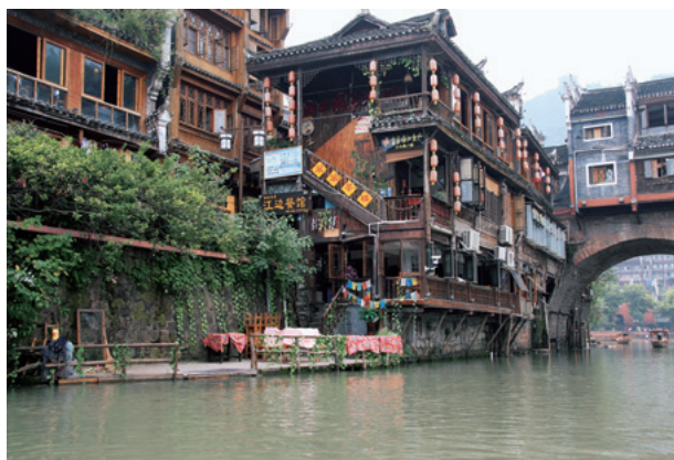
湖南省鳳凰県の風景

発音の勉強とは、声調を含むピンインの発音のしかたを学習することにほかなりません。漢字は1字1音節で、普通話には400余りの音節があります。むろん400余りの音節を1つ1つ覚えなければならないわけではありません。一定の体系を有していますから、覚えるべき事柄はそれほど多くありません。とはいえ、初めて習う言葉ですから、さまざまな困難を感じることもあると思います。それを乗り越えたとき、一衣帯水の隣国の友人たちと語り合うことができるのです。