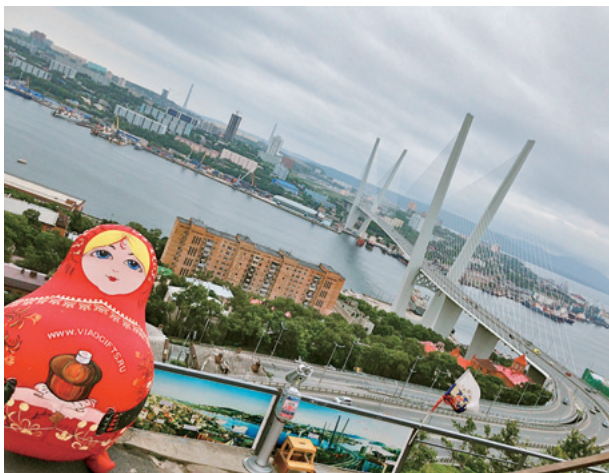
展望台から眺めるウラジオストク

ロシアといっても日本から飛行機で約2時間で行けるウラジオストク。その極東での3週間のサマースクールに参加しました。私は政治コースを選択したので、1限はロシア語、2・3限は国際政治の授業でした。ロシア語の授業では会話を中心に、政治の授業では主にロシアや日本、中国等の極東アジアの政情や国際関係について英語で学びました。授業内容は少し難しかったのですが、北朝鮮の核開発停止に向けた六カ国協議のシミュレーションを行ったりと、とても興味深いものでした。