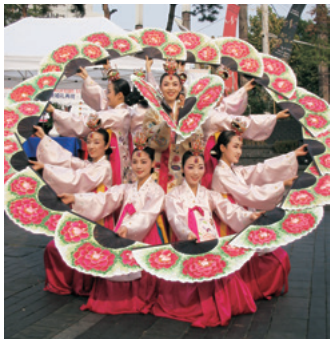
伝統舞踊のプチェチュム

ければならないと考えましたので、その結果、今日のようなハングル文字が誕生しました。