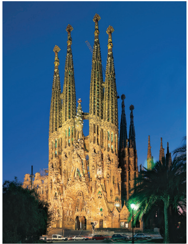
ガウディのサグラダ・ファミリア教会 (バルセロナ)