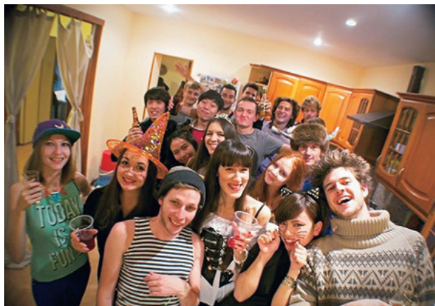
カザン留学中、友人たちと

ロシアに留学したと言うとほとんどの人が驚き理由を尋ねます。確かに日本人にとってロシアは寒くて遠くにあるよくわからない国かもしれません。しかし、ロシアでは、私たちの価値観を超えた自然や文化、考え方に触れ、魅力的な経験ができることは間違いありません。私がカザン大学で過ごした10ヶ月はとても濃く、愛であふれたたくさんの人に出逢い、様々な事を乗り越え、いろんな涙を流した時間でした。ロシア人は冷たいイメージがあるかもしれませんが、実はとても愛情にあふれたひとたちばかりです。家やダーチャと呼ばれる別荘に招待してくれたり、ロシア料理と一緒に作ってくれたりなど様々な経験を通して彼らの愛情を感じる事が多々ありました。今思い出せば、留学当初はひどい片言でしたが、それでも先生や友達はみな一生懸命理解しようとしてくれ、訂正しながら気長に接してくれました。また寮生活ではドイツ・フランスからきた留学