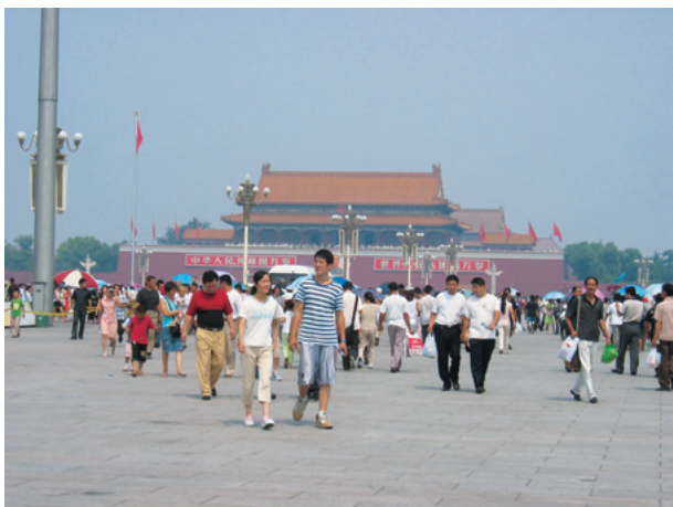
ご存じ 天安門広場

日本の26倍、ほぼヨーロッパ全土に匹敵する国土をもつ中国。13億を超える人々が住む中国。56を数える多民族から成る中国。その中国で使用される言語が一様であるはずありません。実にさまざまな方言が使われています。そうした地域方言も中国語の一つですが、私たちが勉強する中国語は“普通話”(プートンホア)と呼ばれる共通語です。