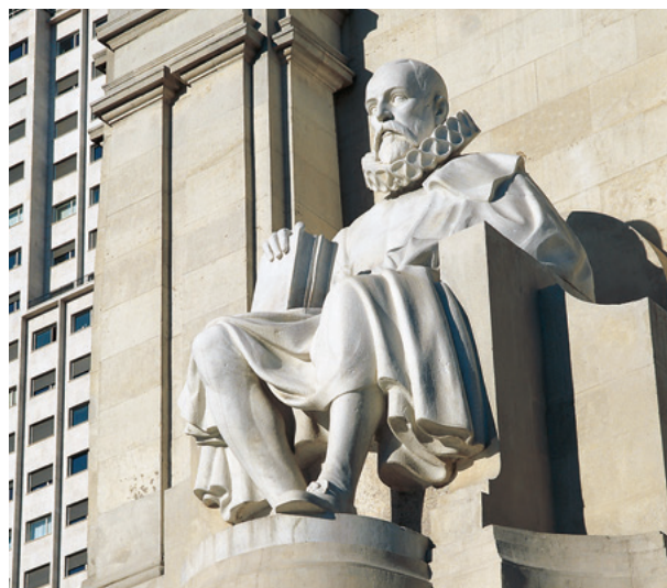
セルバンテス像 (マドリード)

スペイン語をマスターすれば、同じラテン語から派生したポルトガル語・フランス語・イタリア語の勉強も取り組みやすくなります。ちょっとお得感があるませんか?特にスペイン語とポルトガル語の違いは、日本語における標準語と関西弁の差くらいしかないと言われています。