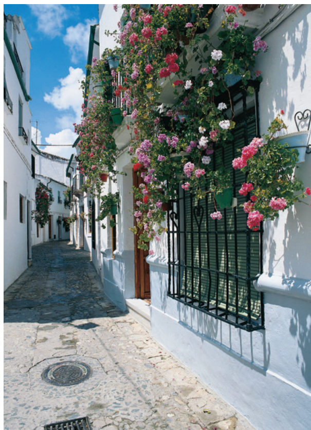
花の小径(コルドバ)