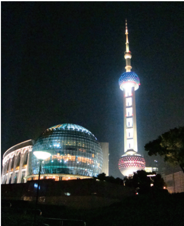
上海の象徴テレビ塔

大学での第2言語として中国語を選んだ理由としては、ちょうど中国経済が盛り上がりつつあったので将来的に必要になりそうかなという思いと以前に興味を持ったことを思い出したことです。他に興味を持った言語のドイツ語が専門科目の時間と被っていたことも決めた要因ですが、また、高校時代から留学には興味はあり、夏季休暇中に約1ヶ月間の短期留学が中国・大連もしくは台湾にいけるプランがあったことも理由のひとつでもありました。予定が合わず今年は参加できなかったのが残念です。