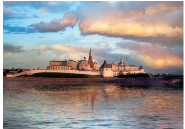
カザン・クレムリン（世界遺産）