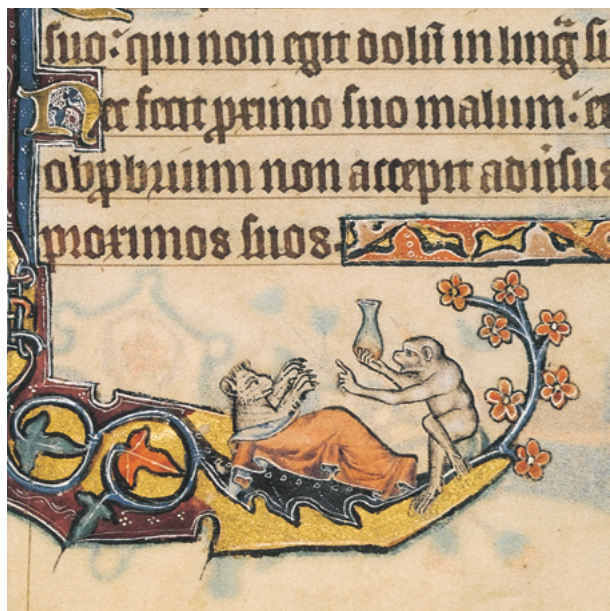
The Macclesfield Psalter (14世紀のキリスト教祈禱書、Cambridge, Fitzwilliam Museum)

古典ラテン語は古代ローマ時代に用いられた言語で、文字はアルファベット24文字です。この文字はその後、英語など、現代ヨーロッパの多くの言語で使用されるようになりました。紀元前1世紀から紀元後1世紀の、いわゆる古典ラテン文学の黄金時代には、キケロ、ウェルギリウス、オウィディウス、セネカ、カエサルなどにより、多くの作品が創り出されました。