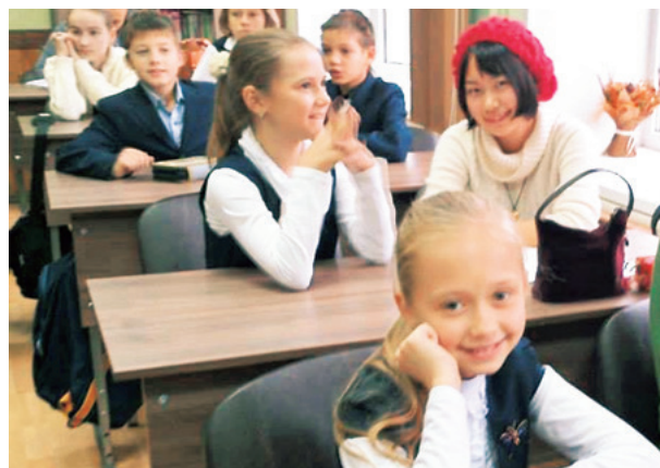
カザン留学中、日本語を学ぶ生徒たちと

私は2年生の後期から10ヶ月間カザン大学に留学しました。カザンは穏やかで美しい街で、物価も安く生活費がそんなにかからないので、留学には最高の環境でした。授業は、文法、語彙、コミュニケーション、発音、手紙の書き方、歌、映画、文学など種類が豊富で、どの授業でもとにかく話すことを求められました。先生たちはとても熱心な人たちばかりで、毎日真剣に授業を受けていれば10ヶ月でも確実に高いレベルのロシア語を身につけることができます。実際、留学前は初心者レベルだった私のロシア語も、留学後にはロシア連邦認定の検定試験ТРКИ第2レベル(ロシアの大学院に入学可能なレベル)まであがりました。学校以外でも、ロシア人の友達との交流や旅行や日々の生活を通して、教科書にはのっていない生のロシア語を身につけることができ、いつのまにかロ