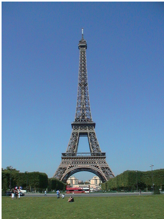
パリのシンボル エッフェル塔

Bonjour, tout le monde ! (ボンジュール、トゥルモンド) 皆さん、こんにちは。金沢大学へようこそ。