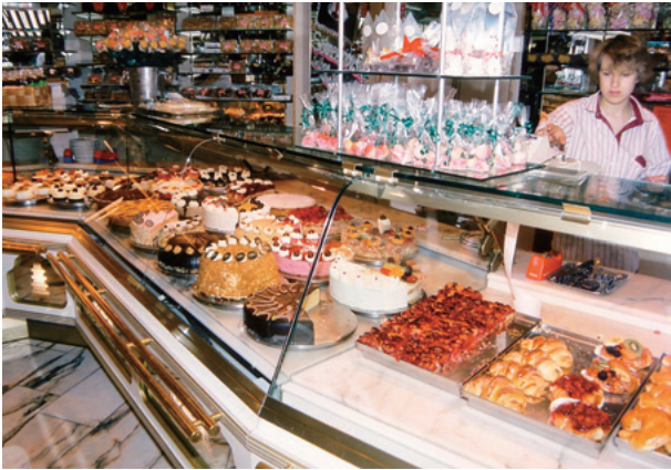
ドイツのケーキはボリューム満点！

ロッパの情報や、逆にヨーロッパの人たちから見た、日本やアジアのさまざまな情報を手に入れることができるでしょう。こういった情報は、みなさんの世界観を広げたり深めたりするのに、間違いなく役立つはずですよ。