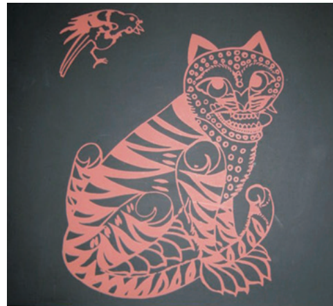
韓国の象徴 トラとカササギ

私が一番嬉しかったのは、クラスメイトとは授業中も、その後のランチタイムも韓国語で話すという機会が得られたことです。目的が単に専門を英語で学ぶという留学生が多い中で、韓国語が共通語となるのはこ