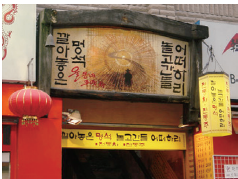
ハングル文字で書かれた看板

現在、ハングル文字の制作動機や文字の原理などを記録したものが残っていますが、その記録本が、1997年、ユネスコの世界記録遺産に登録されました。