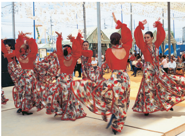
情熱の踊りフラメンコ

ちなみにスペイン語使用国の中で最大の人口を擁する国はメキシコです。「スペイン語=スペインの言語」と思っていた人には意外な事実でしょうね。