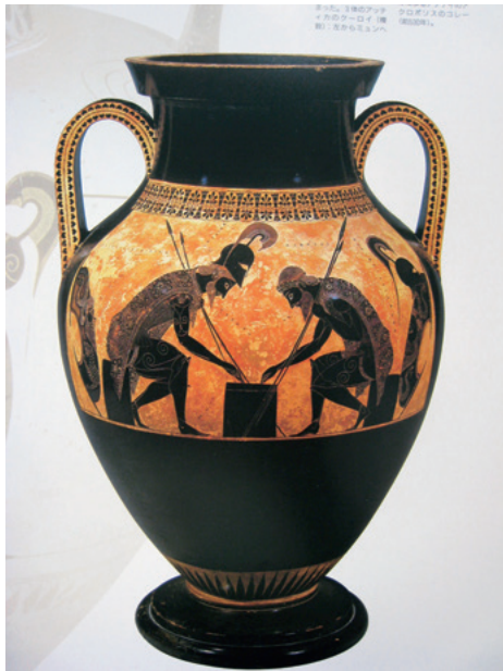
紀元前5世紀の壺絵 チェスをするアキレウスとアイアース

がいざ学び始めてみると、そこは茨の道でした。一つの動詞につき、750を超える活用形、見慣れない「法」「相」「格」という概念、受講者は毎週テキストとノートを開き、唸りながら講義に臨みます。それもそのはず、古典ギリシア語は世界三大難言語にも数えられている言語だったのです。