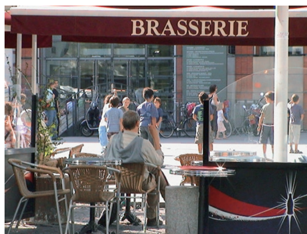
ブラッスリーでの憩いのひととき

では、教室でお会いできる日を楽しみにしています。A bientôt! (アビヤントー) また近いうちに。