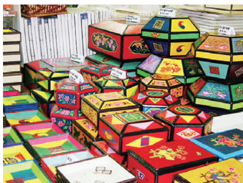
カラフルな箱をおみやげにいかが？

私はもともと韓国に興味を持っており、高校の時から「国際学類に合格して朝鮮語を勉強し、韓国に留学