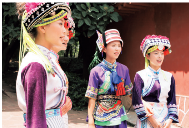
雲南省 少数民族の女性達

興味のあることを好きなだけ学べるのは学生時代だけです。様々なことに挑戦して悔いのない学生生活を送ってください。