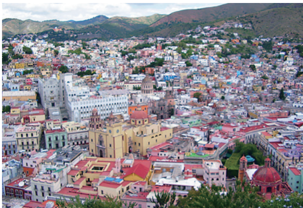
メキシコ古都グアナファト

年に3回、スペイン語検定試験DELEもあります。これはスペイン教育文化省より授与される公認資格です。折角学んだスペイン語の腕試しにいかがですか？