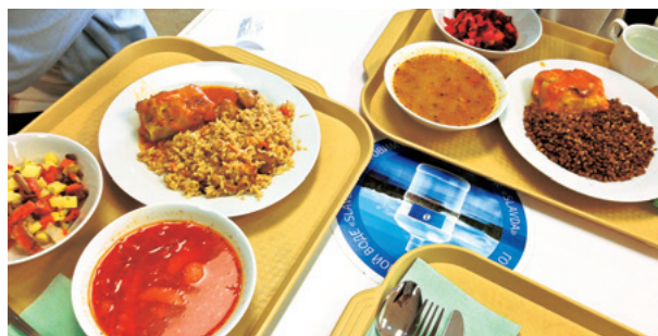
ボルシチ、そばの実、ピーツのサラダなどのロシア料理 @極東連邦大学学食

市内散策やマトリョーシカ作りなどの体験も日々充実していて、様々なロシア文化に触れることができました。中でもシベリア鉄道旅行は貴重な体験です。寝台列車でウラジオストク - ハバロフスク間を往復しました。