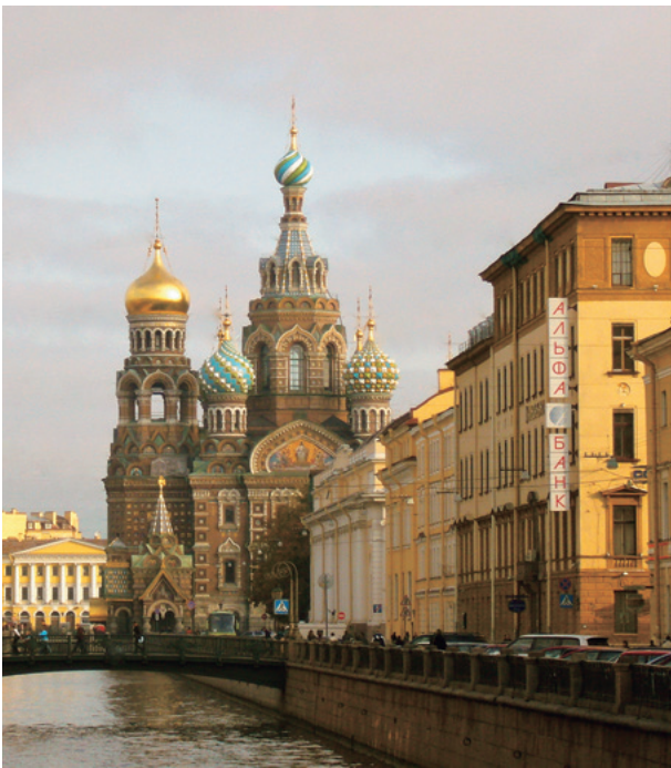
サンクト・ペテルブルグ市街。看板のキリル文字が見えますか?

そんなに近くても、きつとみなさんにとってロシアは 心理的にまだまだ遠い国かもしれません。ニュースでも 報じられるように、ロシアには政治的・経済的に不安 定な時期がときおり訪れます。しかしまさにそのように、 私たちにとって想定外の、異質な側面をもつからこそ、 ロシアはもっと注視し深く知るに値する国なのです。大 学に入学したばかりのみなさんにはぜひ、まったく未知 の言語に挑戦して、新しい世界を切り開ききっかけをつ くってほしいと思います。