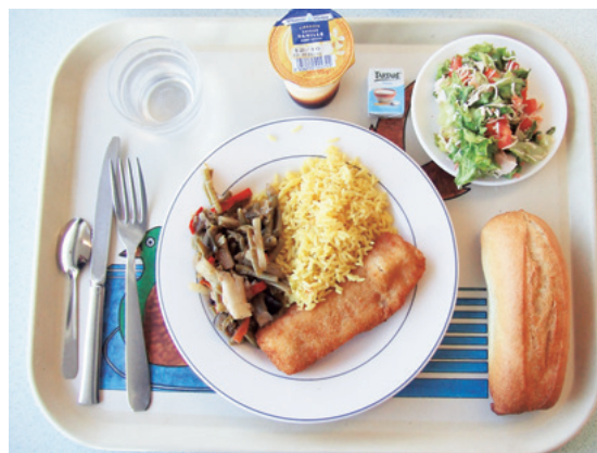
学食もフルコース

ここで得た経験は、今後も何らかの形でフランス語を続けていこうという意欲に繋がりました。