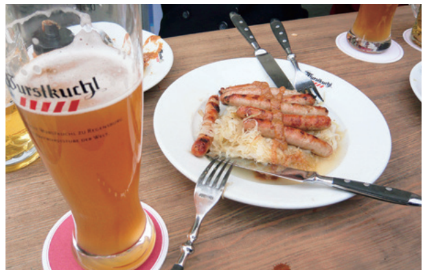
これぞ、本場ドイツのビールとソーセージ！

「その男性が本を持っている」と主語を表す場合には der、「その男性を知っている」と目的語を表す場合には den が使われるのです。この区別を表すのに、英語では the man をどこに置くかが重要でした。他方、ドイツ語では、the man の the に相当する語を、