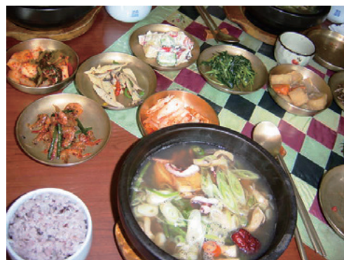
韓国料理の数々。おいしそう。

する」と決めていました。入学直後は、就職のことを考えて中国語にしたほうが良いのかと迷いもしましたが、高校時代から抱いている気持ちと目標を大切にしたい、好きなことだからずっと続けられると思い、朝鮮語を選択しました。