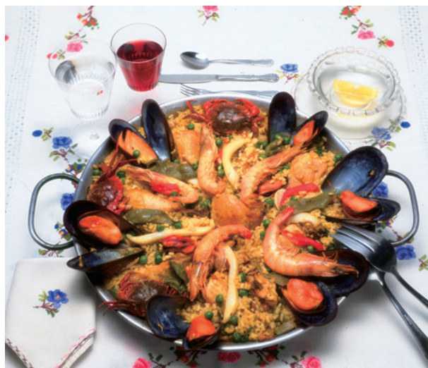
スペイン料理 パエリア