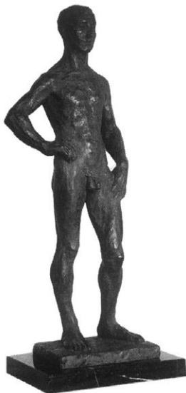
清水多嘉示 男の立像