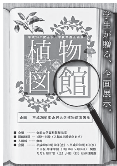
図9 学生企画による展覧会「植物図『鑑』」

大学博物館機能の根幹をなすのが、大学に関連した学術資料の収集・整理・保存であることに異論はないであろう。大学に蓄積された学術資料には多種多様なものがある。それらを学術資源として管理できれば、新たな研究や教育に利用できる可能性があり、あるいは文化資源とすれば、社会に資するような活用方法が見いだせるかもしれない。さらには、大学の学術資料を人類がこれま