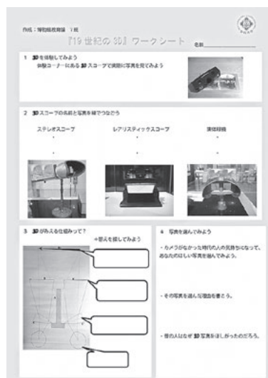
図5 ワークシートの一例 (2013年度博物館教育論7班作成)

こうした資料館の展示会を活用した演習は、学生にとって目的意識を持ちやすく、さらに制作した作品が実際の展示会で活用されることは、学生にとって演習の取り組みに対してモチベーションがあがることに繋がったようである。一方、資料館側にとってもメリットがあった。学生が展示会企画に参加することで、活動のヴァリエーションが増えることや、博物館科目を履修していない一般の学生に対しても、資料館活動に親しみをもってもらう機会になったことなどがあげられる。