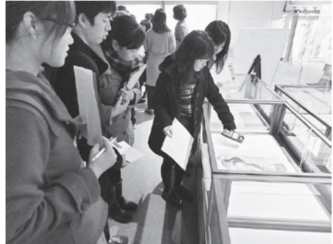
図7 展示室における照度の計測 (2014年度博物館資料保存論)

博物館資料保存論の授業では、資料の展示環境というテーマの際に、実際に展示室で照度を計測する演習を行った。グループに分かれ展示資料ごとに照度を計測し、教室ではその結果を持ち寄って博物館の照度基準と比較した(図7)。