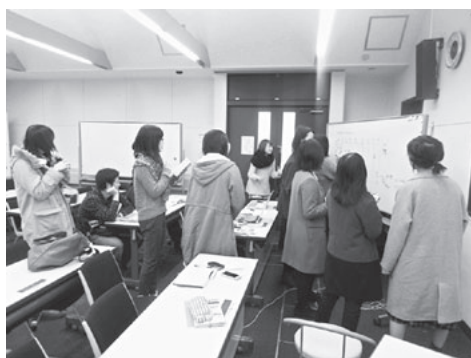
図10 博物館実習での展覧会企画の作業風景