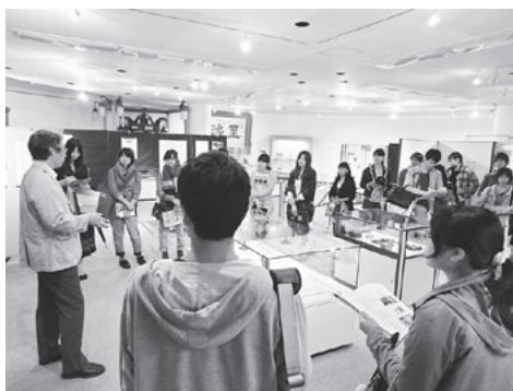
図2 資料館館長による企画展の解説

他にも、博物館情報・メディア論の授業では、企画展『19世紀の3D～ステレオ写真の世界～』(会期：2013年12月11日～2014年3月20日)を題材として、ポスター制作を演習として行った。この演習もグループで行い、完成後は授業内で受講生による評価を行った。制作されたポスターは、資料館展示室が隣接する附属図書館のギャラリーで、展示会を実施した(図4)。