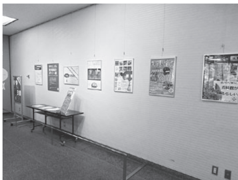
図4 ギャラリーで行われたポスター作品の展示会