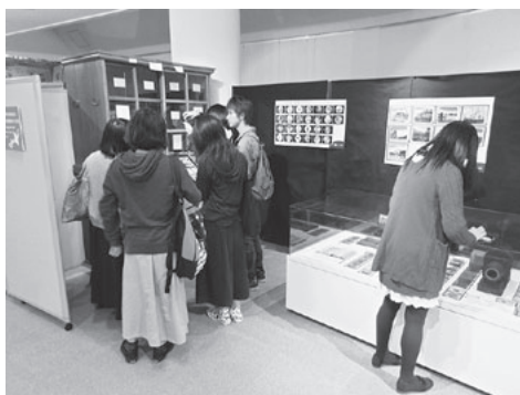
図3 展示室でのCM制作の作業風景