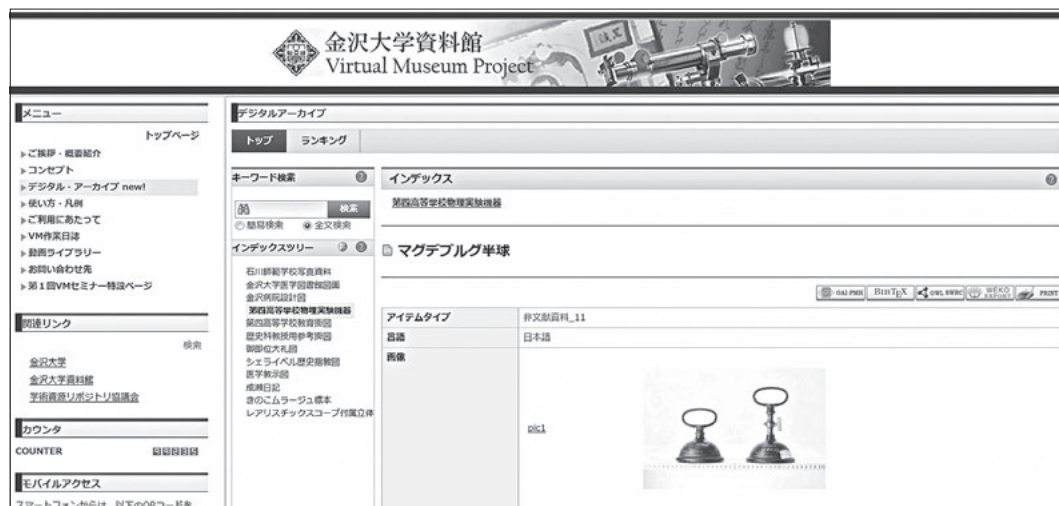
図6 金沢大学資料館ヴァーチャル・ミュージアムのデータベース ( http://kuvm.kanazawa-u.ac.jp/ )

資料館に収蔵されている資料は約6万点を数えるが、そのごく一部が展示会で展示されるのみで、コレクション全体を俯瞰することは難しい。しかし、コレクションの代表的な資料群は、先に触れたweb上で公開されているヴァーチャル・ミュージアムで見ることができる。博物館科目の授業では、資料館の収蔵資料全体を紹介する時にこのヴァーチャル・ミュージアムを活用している(図6)。