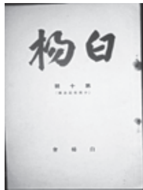
図1 『白楊』第10号（昭和12年）

そこで、本研究では、昭和3年から12年に第四高等学校庭球部によって発行された『白楊』 2) （庭球部部報）（四高同窓会所蔵）の記述をもとに、当時、四高庭球部が最重視していた八高戦の様子と、四高庭球部側から見た八高戦廃止への経緯について明らかにすることを目的とする。