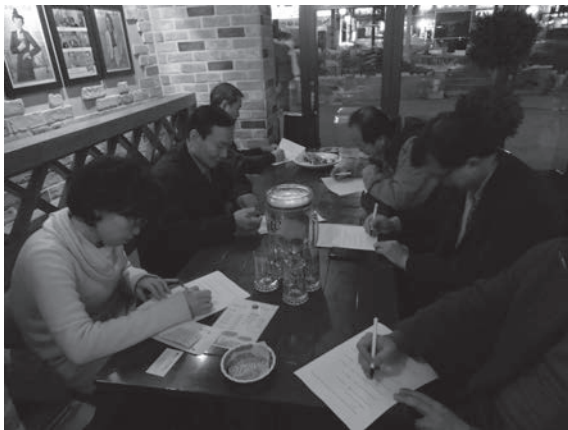
<写真1> 大丘市内のある居酒屋で宴会を始める前にアンケートを作成している調査対象者

本研究は、社会言語学的な調査であるため、既婚男女を調査対象に、夫婦間の呼びかけ表現だけでなく、本人や配偶者の社会的属性に関する情報(年齢・職業などの個人情報)についても尋ねざるをえなかった。