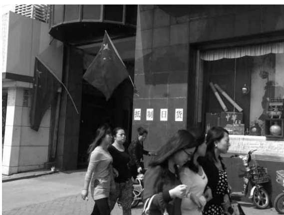
図1 町中に反日姿勢を示すデパート

今回の調査は2012年7月31日から10月4日の65日間に実施した。調査期間中に日中摩擦が不意に深刻化し、日中間の友好往来も急に冷え込むという出来事があった。調査地の山西省の省政府所在地である太原でも、9月ごろ参加者千人ほどの反日デモが起こったのははじめとして、各地で反日姿勢を示す行動が次々に起こった。調査に際しても支障が生じ中断すること