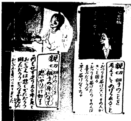
資料7 「親切・思いやり」の学習をまとめた掲示物 親切について学習した後 相手のことを考えると 相手の身になって思いやることだと学習した

心情を共感的に理解させる発問の重要性を感じながら、第2時では、「千夏さんが百花さんを迎えに行き、一緒にいると決心したのはどうしてだろうか」という行為の動機をたずねる発問を繰り返した。それは、即