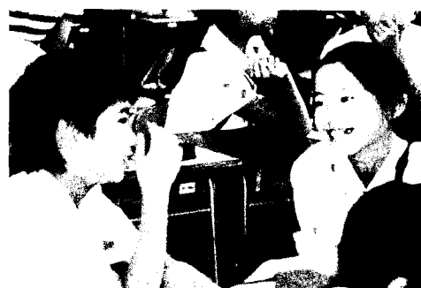
写真1 聴き合う力を育む