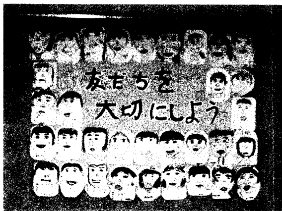
資料8 友だちの笑顔をかけた絵

スキーマを増やすには、『あゆみ』の内容を読み聞かせるだけではなく、「かかわり」に結びつけるようにする。そして、子どもの日々の姿を保護者に伝え、家庭と連携して道徳的実践力を育むようにしたい。