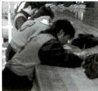
*ワークシート記述及び話し合いの場面