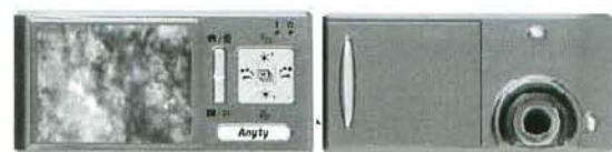
Fig. 1 Mobile digital microscope. (a) LCD side, (b) Object lens side.

デジタル顕微鏡カメラは、R200 Digital Mobile Microscope (スリーアールシステム社製, 福岡市) を用いた (Fig. 1)。イメージセンサーは約 200 万画素の CMOS センサー、倍率は 10 ~ 200 倍、光源は高照度白色 LED の仕様である。なお、今回の調査では光学的に約 10 倍の設定で使用した。