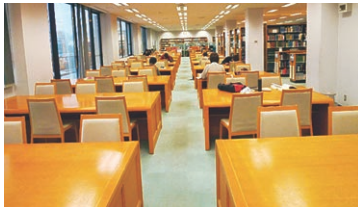
開放的な空間で ゆったりと勉強

静かな場所で集中して勉強したい あなたには、書架周辺にある閲覧席がおすすめです。 閲覧席には、写真のように2つのタイプがあります。用途に応じて、ご利用ください。