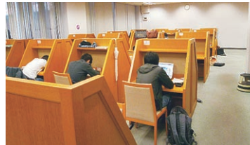
仕切りのついた 机で集中して