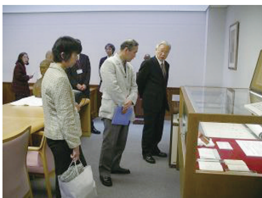
<暁烏敏師の著書等を展示した特別閲覧室の様子>