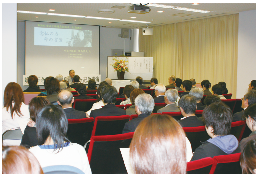
<講演会は聴講の方でいっぱいになりました>