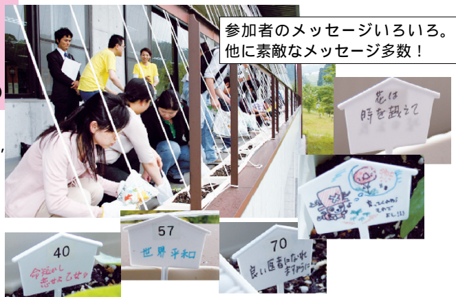
参加者のメッセージいろいろ。他に素敵なメッセージ多数！